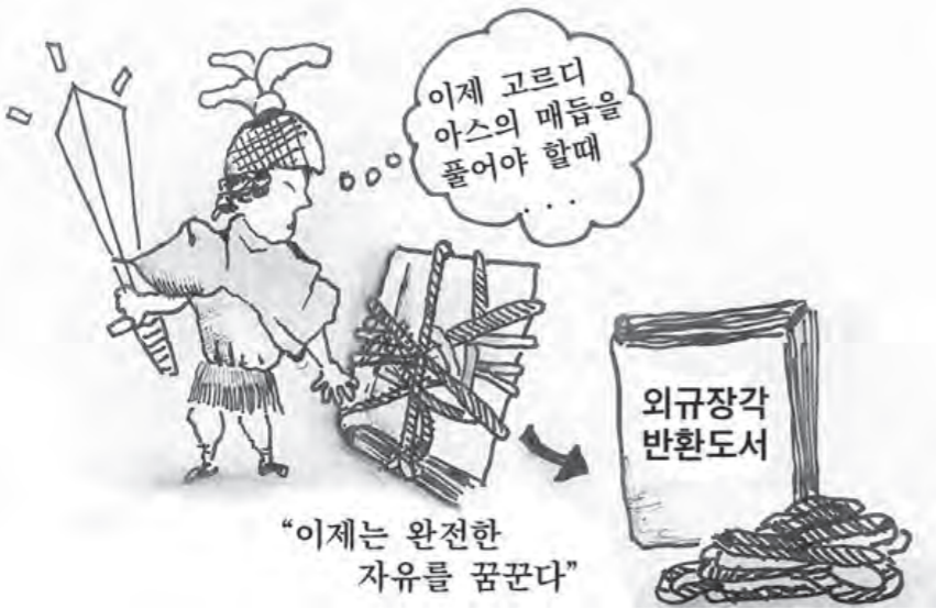
"이제는 완전한 자유를 꿈꾼다"