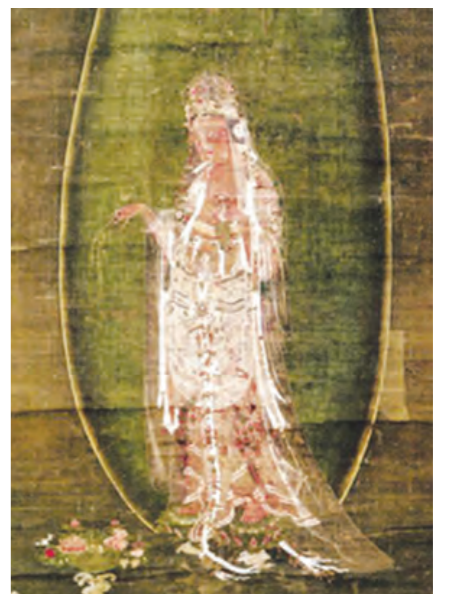
《수월관음도(水月觀音圖)》▲기간 : 10.12~11.21 ▲장소 : 국립중앙박물관 기획전시실