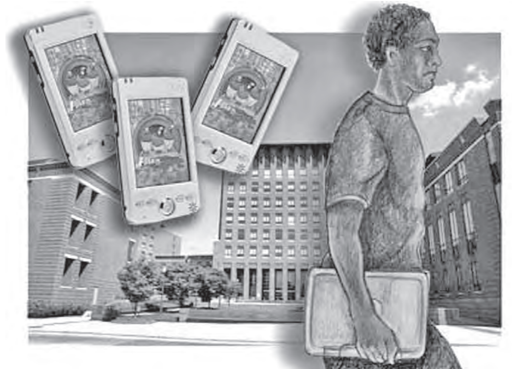
▲ 스마트 기기를 이용해 더욱 스마트한 대학생활을 하는 학생의 모습

방법이다. 바로 스마트러닝 콘텐츠에 적합한 플랫폼을 개발해 이용하는 것이다. 다양한 콘텐츠를 탑재해 스마트러닝의 학사관리와 학습진도 관리가 가능하다. 또한 스마트러닝에 적합한 콘텐츠를 제작할 수 있는 제작도구가 제공돼 쉽게 콘텐츠를 만들 수 있다. 하지만 개발 초기에 콘텐츠가 부족할 수도 있다는 단점이 있다.