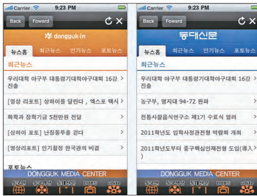
▲실시간으로 학내뉴스를 전달하고 있는 동국미디어센터 아이폰 앱.

이 따른다. 서울사이버대학 콘텐츠 대학의 최준성 주임은 "M러닝을 통해 시간 절약의 효과를 꾀할 수 있지만 PC 에 비해 화면 크기가 작아 보기 어 렵다는 단점이 있다.