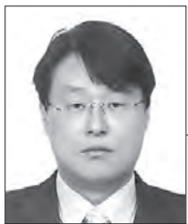
최원기 외교안보연구원 교수