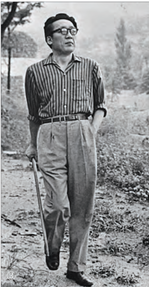
① 영양에 위치한 동탁 조지훈의 생가 뒷당에 위치한 조지훈 시인의 동상. ② 영양에 위치한 동탁 조지훈 시인의 생가. ③ 동탁 조지훈 시인이 지팡이를 들고 길을 걷는 모습.