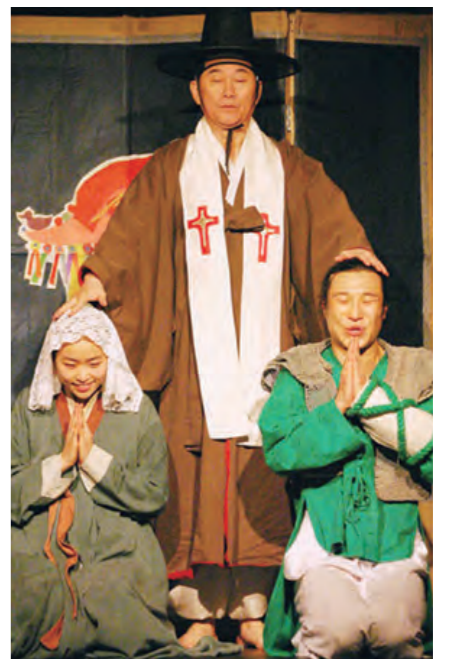
▲기간 : 9.21~10.24 ▲시간 : 화, 금 20:00 토, 일 15:00 ▲가격 : 청소년 20,000원 일반 30,000원