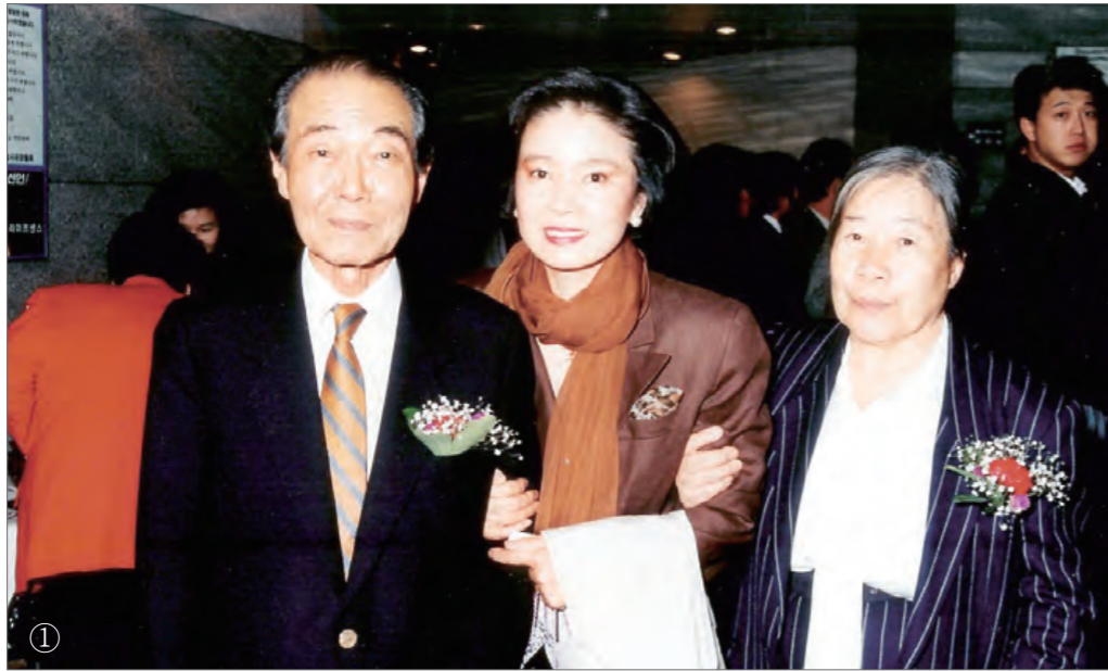
① 한 문화행사에서 부인(오른쪽 끝) 방옥숙 여사, 영화배우 윤정희 씨와 함께 한 미당. ② 고창에 소재한 미당 시문학관의 전경. ③ 남현동 자택에서 가야금을 연주하던 모습.

미당이 세상을 떠났을 때, 한 기자는 시(詩)의 정부(政府)가 스러졌다며 애도사를 썼다. 한국 현대 시의 벼락같은 축복이라는 수사가 과장이 아니었던 한국 현대 서정시의 거장. 우리대학의 소중한 보물이자 모든 한국어 사용자들의 심금을 울리는 ‘마음의 문화재’ 미당, 그의 발자취를 따라가 보자.