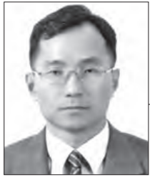
시론 권내현 고려대 역사교육과 교수