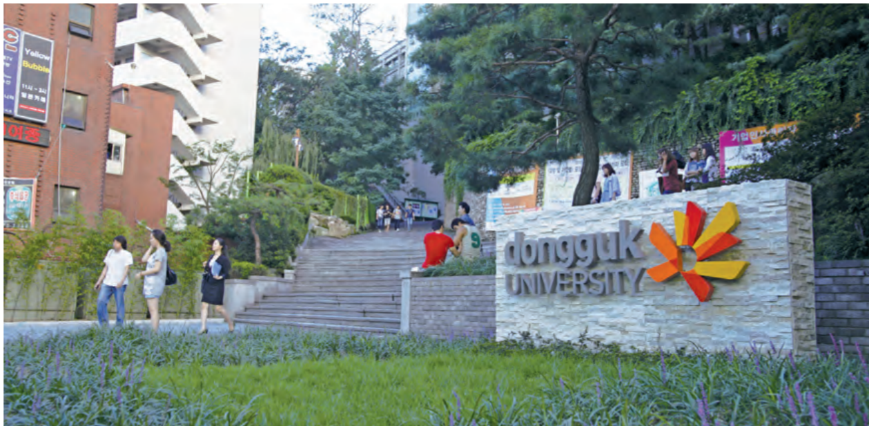
▲세일병원앞 후문이 깔끔하게 정돈된 모습으로 다시 태어났다. 시민들이나 학생들의 반응은 긍정적이다.