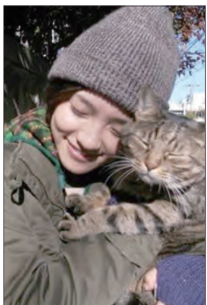
▲나는 고양이 스토커 (I am a Cat Stalker, 2009) 장르 : 드라마, 범죄 감독 : 마테오 가로네

영화제에 가면 반드시라고 해도 좋을 만큼 꼭 한 편 정도는 일본영화를 보게 된다. 상대적으로 진지하고 무거운 영화제 특유의 예술영화들 중 그나마 가볍게 볼 수 있