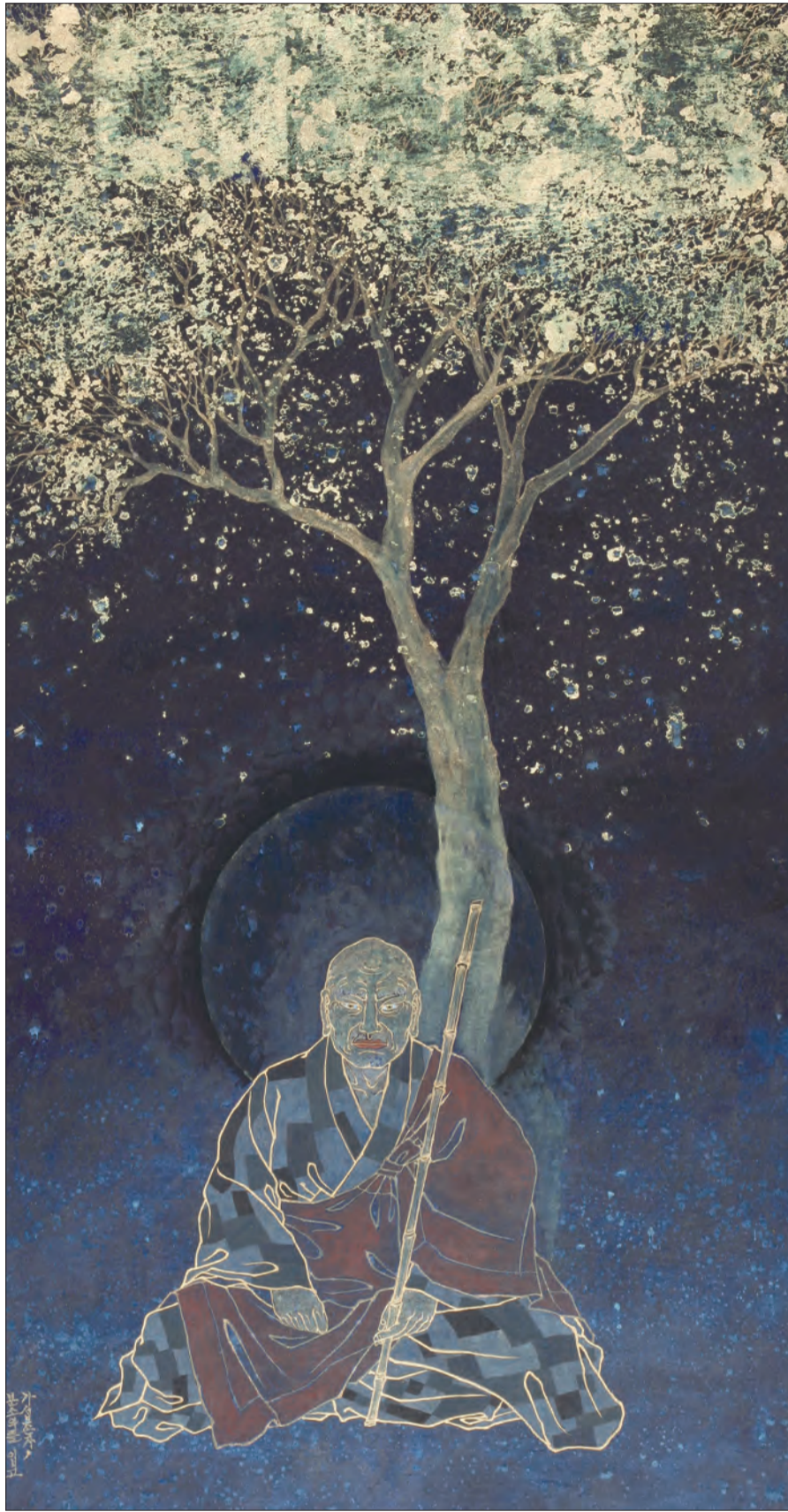
▲ 박경귀 작(作), '가섭존자, 분소의를 입고 고요한 나무아래 앉자'