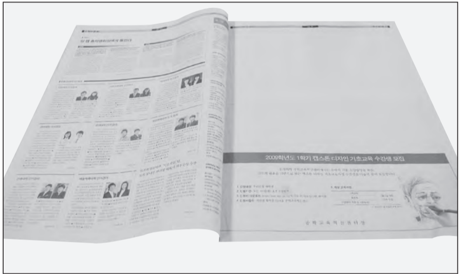
(위부터) ▲여러 대학 학보 사진 ▲지난 2월 2일 진행된 ‘중앙문화’ 언론장례식 퍼포먼스 ▲백지신문으로 발행된 88호 명지대학보

갖지 않는다면 이는 죽은 정보 혹은 주장이 나 다름없다. 이러한 독자들의 무관심을 극복하기 위