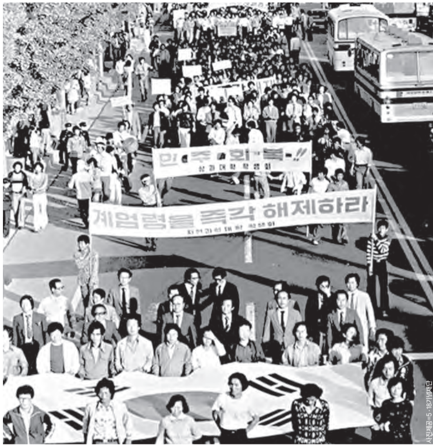
▲민주 회복을 요구하며 거리시위를 벌이고 있는 광주 시민들의 모습

지금으로부터 30년 전, 1980년 5월은 신군부의 쿠데타에 대한 대학생의 저항이 무섭게 타오르던 시기였다. 이른바 '서울의 봄'의 절정이었다. 이에 당황한 쿠데타 세력은 불법적으로 계엄령(戒嚴令)을 발포했고 대학에는 휴교령이 떨어졌다. 이 계엄령에 따라 전국의 주요 대학을 급습한 공수부대가 전남대학에 진주(進駐)하여 학교에 있던 학생들을 무차별적으로 체포한 것은 새벽 2시경이었다.