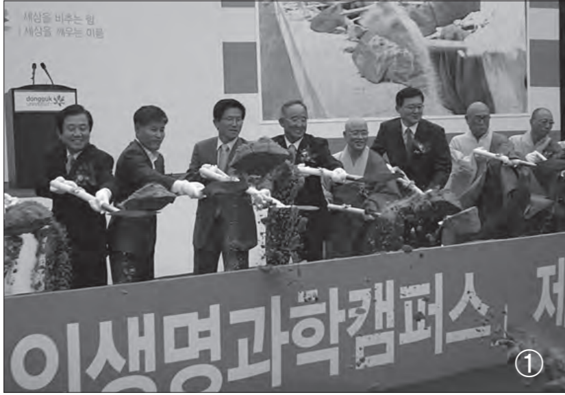
2010년 경인년 새해가 밝았다. 지난 한 해동안 우리대학에는 이수가 많았다. 산학협력관 및 기숙사 착공을 시작으로 일산 의생명과학 캠퍼스 착공과 학내 건물들의 증축 공사가 이어졌다. 국가품질경영대상 표창과 국고지원 사업 600억대 돌파라는 성과도 있었다. 2009년 한 해를 사진으로 정리해 보았다.

도서관·정보문화관 증축, 에스컬레이터 설치 새롭게 변화하는 캠퍼스 국고지원사업 수주 600억원 돌파, 학교발전기금 모금 200억원 등 성과