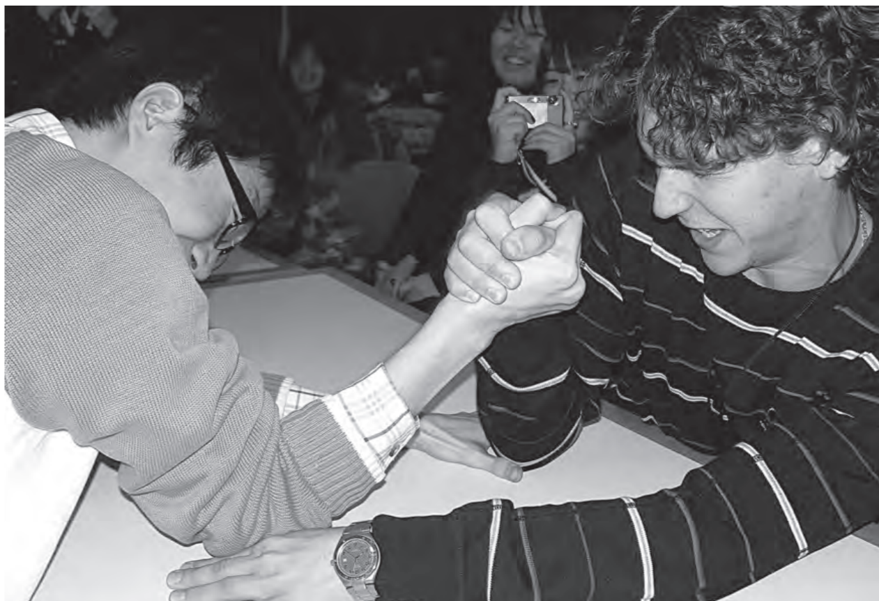
하나 된 마음으로 한판! 국제교류팀은 구랍(舊臘) 21일 상록원에서 International Evening Day 행사를 개최하고 교환학생들과 이들의 유학생할에 도움을 주고 있는 동국 벗(BUD) 학생들간의 친목을 도모하는 자리를 마련했다. 이날 행사에 참여한 학생들은 저녁식사를 함께 한 후 팔씨름 대회를 하며 즐거운 한 때를 보냈다.