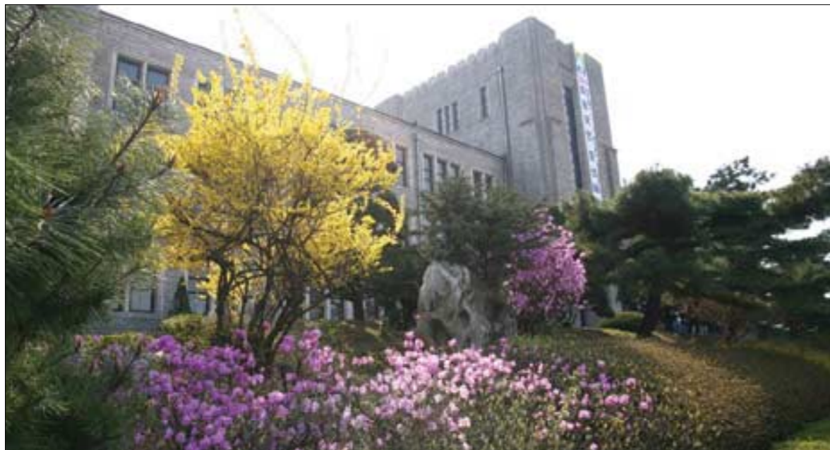
동약의 봄... 예년보다 일찍 캠퍼스에 꽃소식이 전해졌다. 환하게 핀 꽃들처럼 동국인들의 마음에도 따뜻한 봄 기운이 가득하길 기대해 본다.