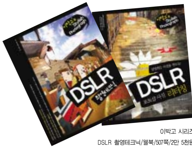
이박고 시리즈 DSLR 촬영테크닉/월북/507쪽/2만 5천원 DSLR 포토샵 사진 리터칭/월북/501쪽/2만 5천원

“인세는 얼마나 받으요?” 사람들은 ‘책을 썼다’는 이들에게 꼭 한 번씩은 이 말을 묻곤 한다. 그런데 이 질문에 이어지는 대답 한마디, “셋이 나눠야 해서 많지는 않아도 제 등록금을 낼 수 있을 정도는 되요.”