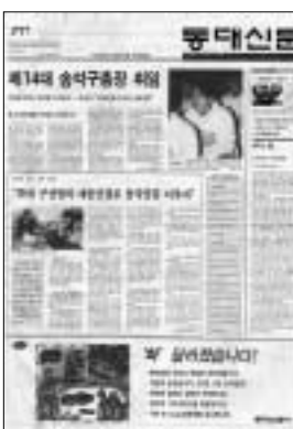
▲ 창간호(50년 4월 15일) 1947년에 동국월보를 창간했으나 일부 논문이 정치적으로 불순하다는 점을 이유로 배부되지 못한 채 압수되고, 발행이 중지된다. 이후 1950년 4월 15일이 되어서야 대판 4면 순간체의 동대신문이 창간됐다. ▲ 제200호(02년 7월 12일) 동대신문은 '동대월보', '동국월보', '동대신문', '동대시보' 등 수차례의 제호변경을 거쳐 창간 12년 만에 '동대신문'으로 제호가 고정된다. 이와 함께 불규칙적으로 간헐되던 신문은 주간제로 정기발행된다. ▲ 제1012호(09년 3월 1일)창간 이래 견지해온 세로쓰기를 버리고, 독자의 요구에 맞추어 가로쓰기 편집체제로 새롭게 태어난다. ▲ 제1265호(99년 3월 1일) 한글로 제호를 변경하고, 1면과 8면을 컬러 인쇄 한다.