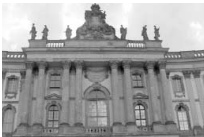
독일 베를린 훔볼트대학교

미국, 캐나다, 일본, 인도, 필리핀, 그리고 영국계 아프리카 국가들은 적정 수준의 등록금을 부과하는 정책을 시행하고 있다. 즉, 대학교육비의 1/3~1/5정도를 학부모가 부담하고, 나머지 대부분은 정부가 보조하고 있다. 이러한 정책의 근거