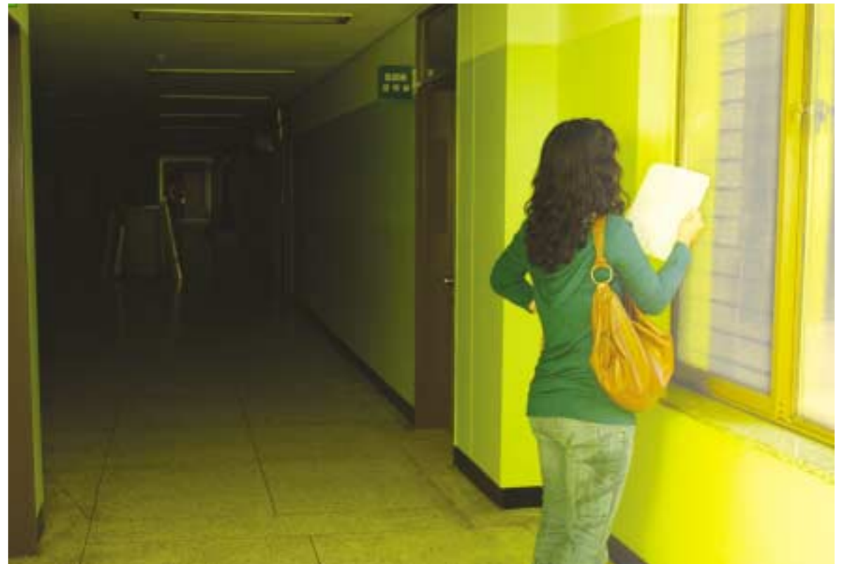
'암흑의 순간'... 지난 6일 한국전력 신당변전소 내 가스절연개폐장치 고장으로 인해 학교전체가 약 1시간 가량 정전되는 사태가 발생했다. 우리학교는 은행 및 각 행정부서에서 각종 피해가 발생한 것으로 보인다. 사진은 정전된 후 침묵에 들어오는 빛을 통해 글을 읽는 여학생의 모습.