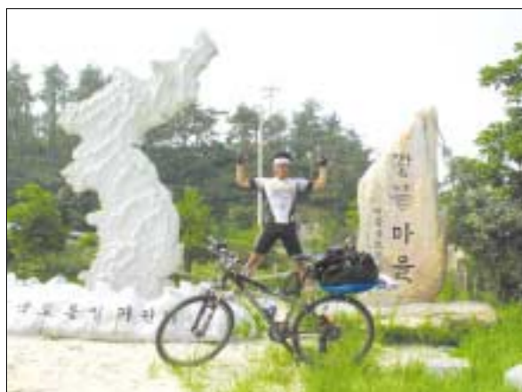
▲ 전라남도 해남 땅끝마을