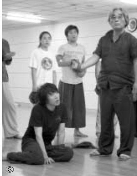
① 1972년 이윤택 교수가 제작, 주연, 연출한 '출발' ② 대학원생과 토론식 수업을 진행하는 모습. ③ 예술의 전당 연습실에서 진행된 뮤지컬 '공길전'을 지도하는 모습.