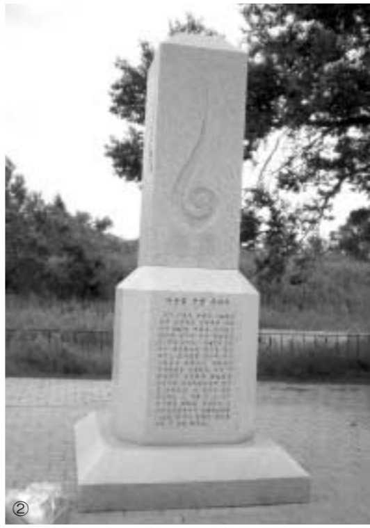
② 블라디보스톡역의 시베리아 횡단열차 ③ 이상설의사 유허비 ④ 신한촌기념비 ⑤ 하바롭스크 성모 승천사원에서 필자

독수리 전망대에서 내려와 우리는 다음 행선지인 하바롭스크로 가기 위해 블라디보스톡 역으로 향했다. 말로만 들던 시베리아 횡단열차를 타게 돼