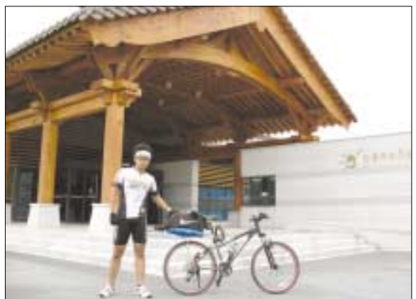
▲ 경상북도 안동 독립운동 기념관

난 꿈이 많은 사람이다. 하고 싶은 것도 많고 경험하고픈 것도 많고 욕심도 많다. 꿈이 많기 때문에 난 그 꿈들을 보며 살아간다. 그 꿈들 중에 하나인 자전거 전국일주. 자전거로 우리나라의 국토를 일주하는 것. 이것은 지난 10년동안 내 머릿속을 간질이던 하나의 주된 주제였다.