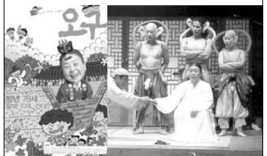
▼ '오구'의 영화포스터(왼쪽)와 연극 '오구'의 한 장면(오른쪽).