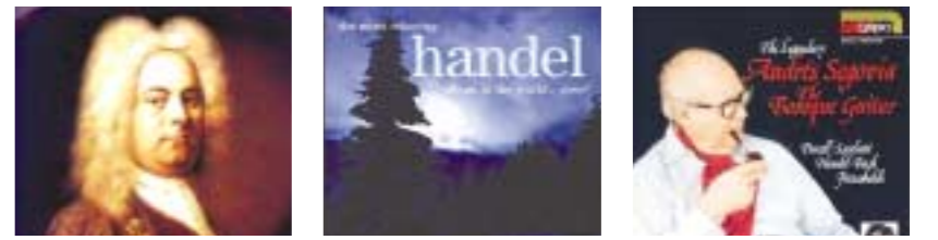
▲ 게오르그 프리드리히 헨델(맨 왼쪽)과 헨델의 사라방드를 연주한 음반들.

물이 흘러도 물 아래 바위들은 그대로 있듯 세월이 흘러도 늘 남아 있는 것, 바로 추억이다. 이렇듯, 세월의 흐름은 늘 우리에게 수많은 추억과 기억들을 남겨놓는다. 회화동 대학로 끝자락의 어느 버스 정류장 앞. 내 기억 속의 ‘그 언젠가’에는 나지막하고 허름한 이층짜리 건물 안에 아침의 수줍은 햇살이 하얀 손으로 레몬 빛 소파를 쓰다듬던 그런 아늑한 공간이 있었다. 사라방드(sarabande). 세월 저편으로 사라진 그곳은 언제나 커피 향 가득한 그저 평범한 찻집이었지만, 내 기억 속에는 독일 출생의 영국 작곡가 헨델(Georg Friedrich Handel, 1685~1759)의 사라방드만이 가득했던 그런 곳으로 자리 잡고 있다. 건물 외벽에 걸린 간판이 부끄러워할 정도로, 일부러 신청하지 않으면 사라방드를 좀처럼 들을 수 없었던 그런 곳이었으면서도 말이다.