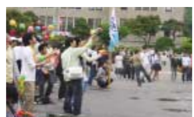
지난 11일 본관앞에서 열린 문과대 시위