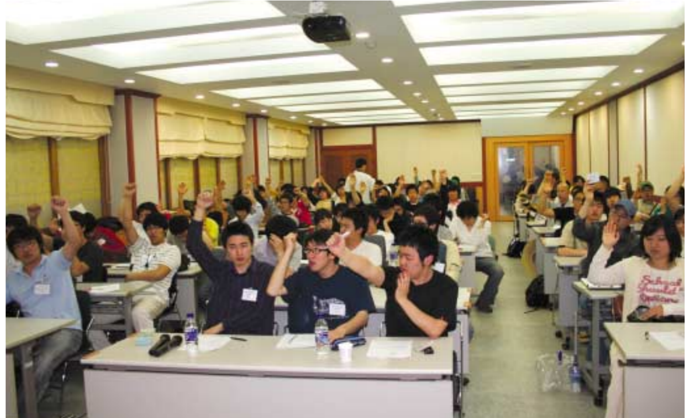
"의견 모아 큰 소리" ... 전체 학생대표자 회의가 지난 11일 다량관 세미나실에서 열렸다. 재직인원 92명 중 75명이 참석한 이번 회의에서는 2008학년도 학제개편안에 대한 반대 입장과 그에 따른 향후 학생회 활동방향 등을 결정했으며, 2007년도 등록금 할인을 수용하기로 했다. 기타 안건으로는 학내성폭력 문제와 관련해 학칙강화를 요청하기로 했다.