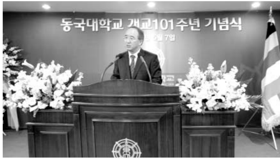
“다시 시작합시다” ...