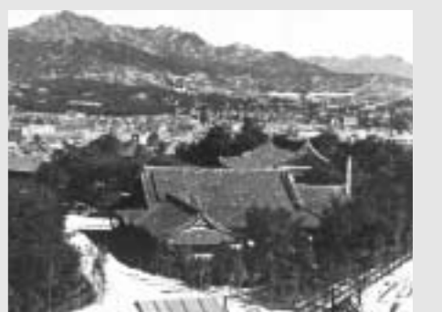
초기의 필동 캠퍼스

해방이 되자 각 학교는 개교와 함께 교육정상화를 위해 분주히 움직였다. 1946년 6월 문교부는 미군정기 공포한 대학령에 의거하여 '고등교육제도의 임시조직'을 발표하였다. 이 조치에는 3개 이상의 단과대학을 종합한 규모의 대학을 '종합대학교', 인문 혹은 자연과학 한 단위로 한 기관을 '대학'으로 한다는 기준이 포함되어 있었다.