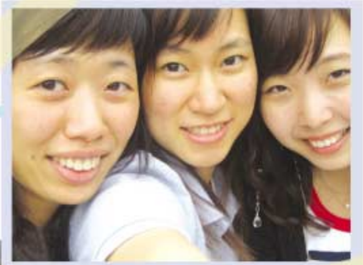
2006년 9월의 어느날

스치듯 지나가는 가을이 아쉽다면 소중한 사람과의 추억을 한 장의 사진으로 남기는 건 어떨까요?