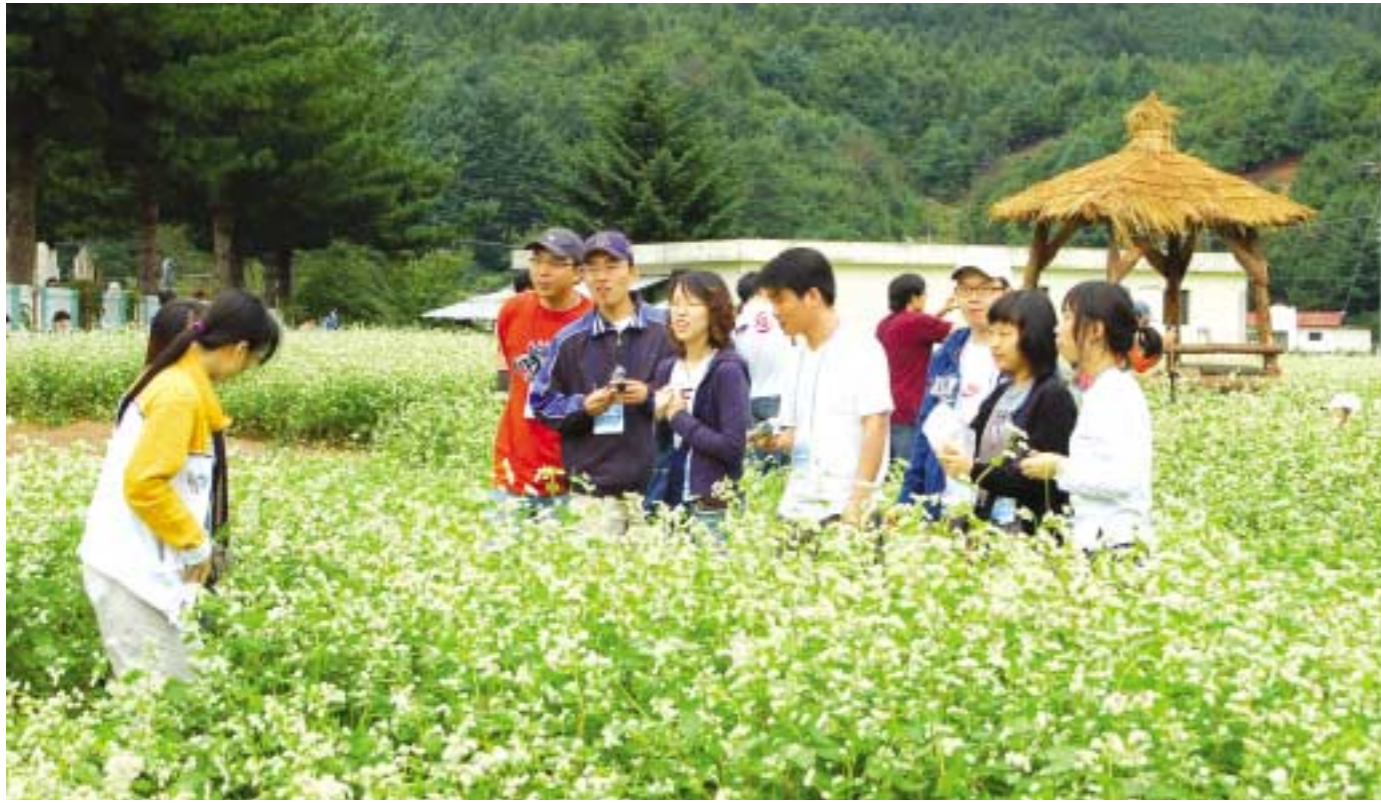
"메밀꽃 필 무렵" ... '피기 시작한 꽃이 소금을 뿌린 듯' 메밀꽃이 흐드러지게 피었다. 중앙도서관은 지난 9일(토) 제1회 도서관 학기행 프로그램으로 이호석의 소설 '메밀꽃 필 무렵'의 배경이 되는 봉평을 방문해 호석문학관 관람 등 호석문화제 행사에 참여했다. 대학부 dgupress@dongguk.edu