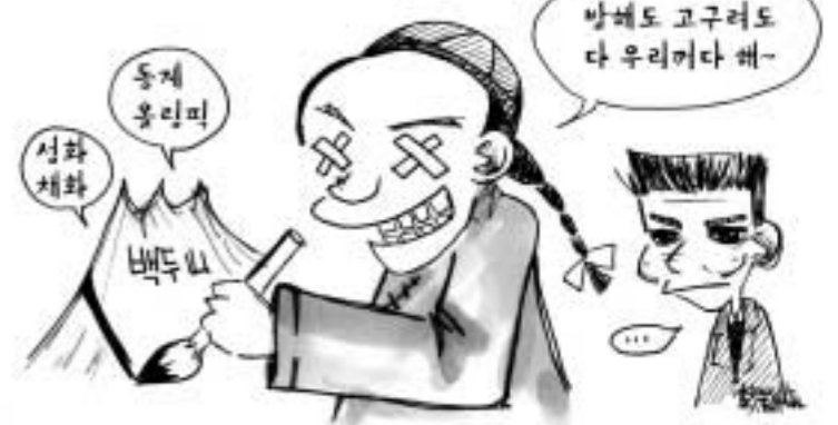
되는게 있는 이나, 눈뜨고 지켜보는 이나...