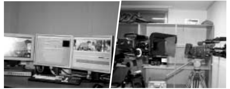
10억원 이상의 예산이 투입된 세계 최고 수준의 첨단 신 기자재

- 2006, 2006년 2년 연속 수도권 대학특성화사업에 선정된 우리학교만의 장점과 문화콘텐츠에 대해 간략히 정리한다면.