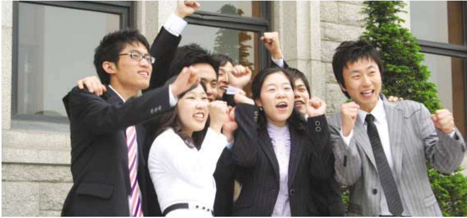
“우리 졸업해요!” ...

졸업앨범 사진 촬영이 지난 15일부터 오는 6월 1일까지 진행될 예정이다. 사진은 부모님께 감사인사 동영상 촬영을 하고 있는 학생들의 모습.