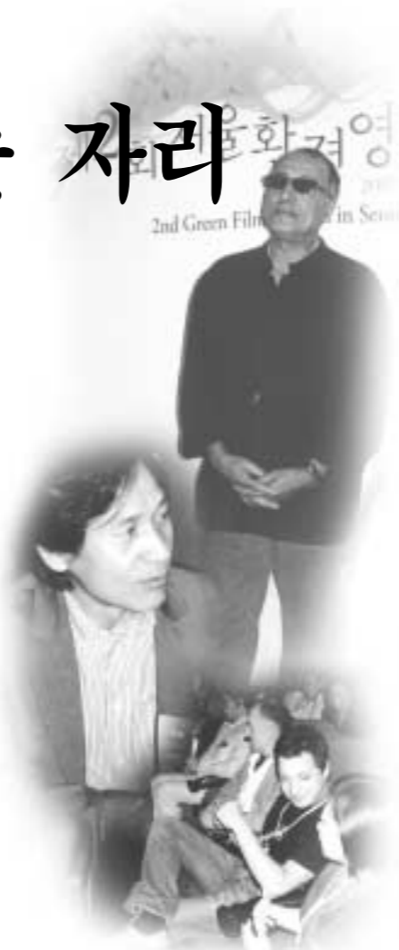
보다 적극적으로 환경보호를 실천해 사람들에게 환경의 중요성을 설득할 수 있는 운동이 필요할 것으로 보인다.