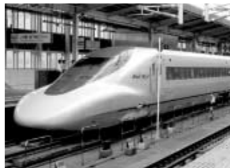
▲ 일본의 신칸센.

패망이후 1950년대 이후에 국가경제가 서서히 회복되었을 때 철도산업 부흥을 위해 주요 철도노선의 에너지원을 전기로 하는 전철화를 시켰고, 인구 밀집지역인 도쿄와 신오사카와의 구간에서 시속 200km 이상의 신칸센을 건설하였다. 이후 국유철도 경영의 방만한 운영과 합리적 경영을 무시한 투자남발로 재정적자를 겪던 일본국유철도는 1987년 그때까지 유례가 없는 분할 민영화를 택하여 철도산업 운영에의 새로운 도약을 맞이했다. 현재의 차륜방식으로 운행하는 상업용 철도는 최고 시속 300km 내외의 속도로 운행하고 있다. 21세기에 들어서면서 일본의 도전은 소음과 진동이 적고, 기후조건에 영향을 덜 받으며, 보수에 대한 비용이 적게 들어가는 자기부상열차 개발에 투자를 하고 있다. 1979년 무인 실험차량으로 시속 217km를, 그리고 1999년 4월 14일에는 유인으로 시속 522km를 기록하였다. 자