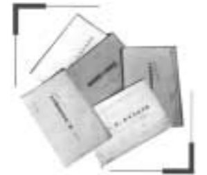
▲ 해화 전문학교의 요람