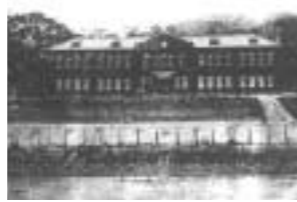
▲ 불교전수학교의 교사