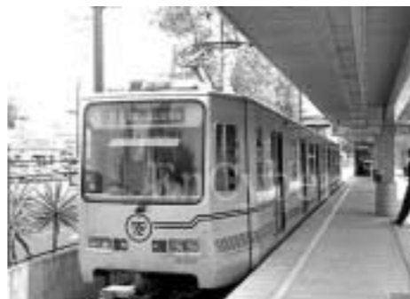
▲ 멕시코의 리베로.