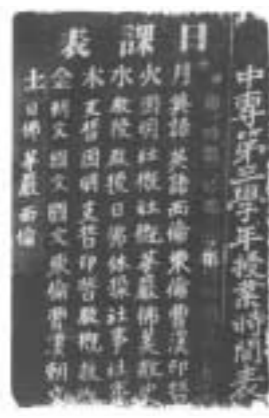
▲ 당시의 수업 시간표