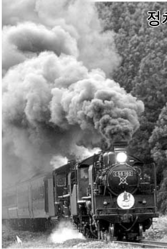
오는 18일은 '철도의 날'이다. 철도는 산업혁명과 같이 등장했다. 이는 정치·경제·사회·문화 등 인간생활 모든 부문에서 비약의 계기가 됐다. 이에 철도역사부터 현대까지 미치기 된 영향을 알아보자.