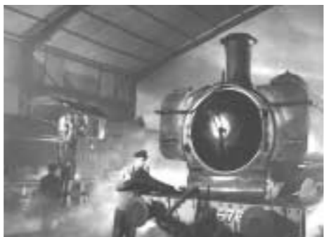
▲ 초기의 증기기관차.

인간의 이동방법과 수단은 바퀴의 발명을 기점으로 이전과는 질적으로 달라졌다. 그리고 바퀴는 보다 효율적인 이송의 방법을 고민하게 하였고, 인간과 가족의 힘을 벗어나 기계적 원동력을 찾는 것으로 발전하였다. 산업혁명이 증기기관과 더불어 시작되었다고 말할 수 있다면 증기기관을 동력삼은 철도는 유럽의 산업혁명을 세계로 나아가게 하였다. 19세기에 최초의 철도가 부설된 이후에 유럽은 국가별로 철도산업의 기술과 운영체계가 발전되어 왔다. 북미, 아시아, 아프리카 대륙이 운영체계에 기술상에 있어서 국가별 차이가 크게 없는 것과 비교하면 현재 유럽은 단일 시장체제로의 출범에 의해 철도산업의 환경이 바뀌고 있다. 유럽연합(EU)은 2020년을 목표로 유럽대륙 차원의 고속철도 발전계획을 1990년에 수립하고, 이것이 유럽연합건설에 큰 역할을 할 것으로 기대하고 있다. 유럽의 대륙을 누빌 철도는 하나의 유럽을 상징할 것이고 지금까지의 타운송수단과의 한계는 경쟁관계에서 있었던 유럽의 철도 산업은 부흥기를 맞이할 것으로 전문가들은 예상하고 있다. 영국 기술자에 의해 1872년에 시작된 일본의 철도는 기간산업으로 꾸준한 투자와 세계적으로 가장 낮은 운행거리당 사고건수로 일본을 철도왕국으로 만들었다. 초기에 민간투자를 유도하여 시작된 철도 건설과 지속된 기술개발은 1920년대에 철도기술에 있어서 유럽과 대등한 위치를 점하게 되었고, 축적된 기술력은 당시에 일본이 자행한 식민지 수탈의 도구로서 조선을 시작으로 동북아시아에 철도를 건설하게 이르렀다.