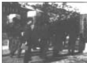
▲ 불교전수학교 학생들의 등교모습