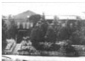
▲ 해화 전문 교사