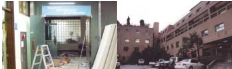
개강후에도 공사가 진행중인 동국관 M동 2층 충무로에 위치한 산학협력센터(신관) 외관