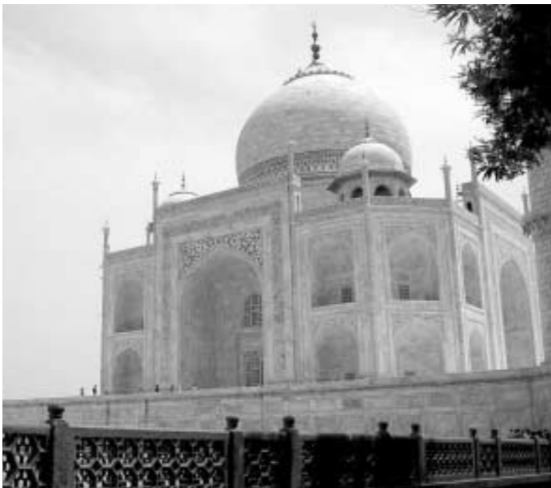
타지마할 ... 지난 여름방학 동안 인도에 다녀왔습니다. 멋진 풍경 사진을 혼자보기도 아까웠습니다. - 강건욱(인철4)