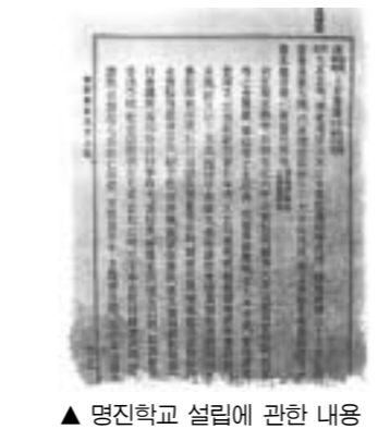
▲ 최초의 졸업장

우리학교가 내년에 개교 100주년을 맞는다. 이에 지난 동국역사 속에서 히노애락을 살펴보고 100주년을 준비해 편집자