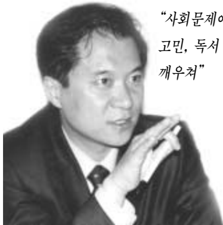
“사회문제에 대한 고민, 독서 통해 깨우쳐”

현대·기아차 그룹은 이번 인사와 관련해 "격화되는 자동차산업 경쟁력 확보에 필수적인 부품산업 부문의 글로벌 경쟁력 강화를 위한 것"이라고 설명했다.