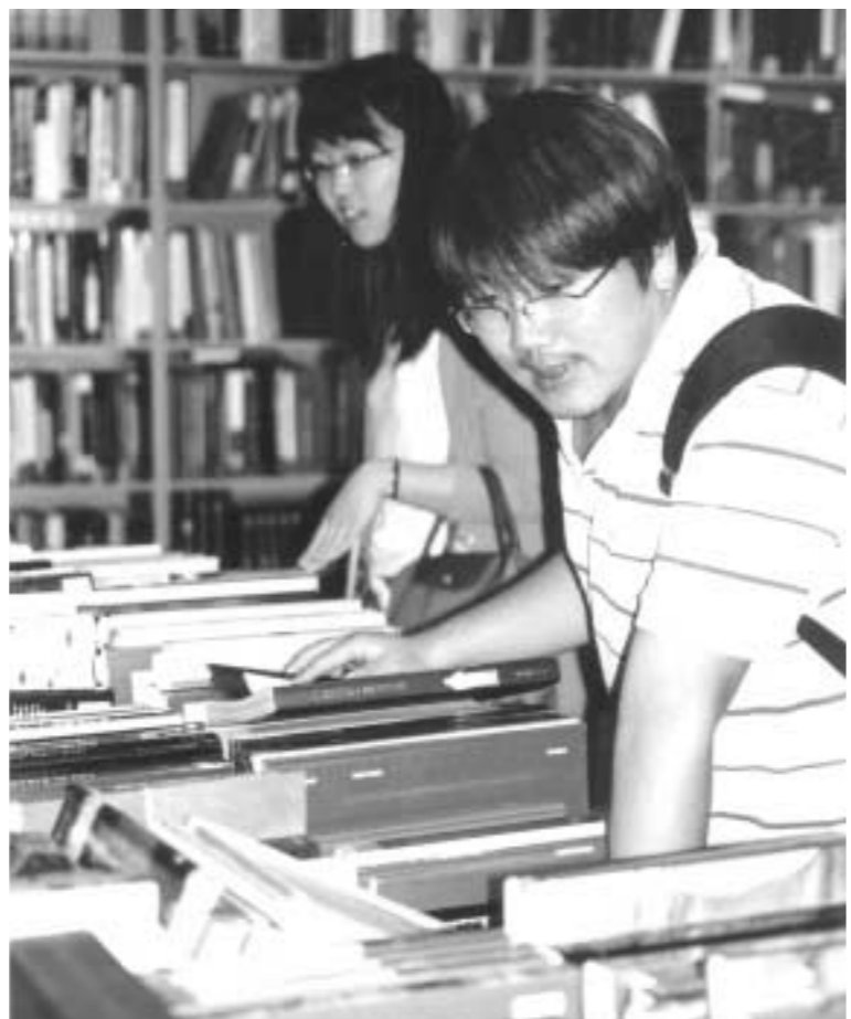
우리가 배울 책... 외국 학술 도서 전시회가 지난 2일부터 3일간 중앙도서관 전시실에서 열렸다. 연구·수업에 필요한 원서를 교수가 직접 보고 추천하기 위해 마련된 이번 전시회는 약 5천여권의 외국 도서가 전시됐다.

'5개 분야 16개 단위사업'을 구체적으로 살펴보면 다음과 같다. △정보·문화에 관한 사항=본교 법당시설 주민이용 개방, 본교 체육시설 개방 등 △지역개발에 관한 사항=각종 위원회 본교 교수 위촉 △지역환경개선 및 주민복지=총무아트홀 스포츠센터 위탁 운영, 동국대학병원 의료봉사 등 △사회교육프로그램을 통한 지역주민교육 기회제공=주민·구청직원 위탁 전산교육, 영상체험·교육 및 시네마테크운영 △기타 양 기관의 발전과 후호증진=본교 우수학생 장학금 지급, 본교생 아르바이트 기회 확대이다.