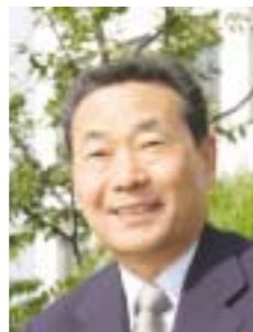
이석현 의무원장 고려대학교 구로병원 원장 국제소아정형외과학회 회장