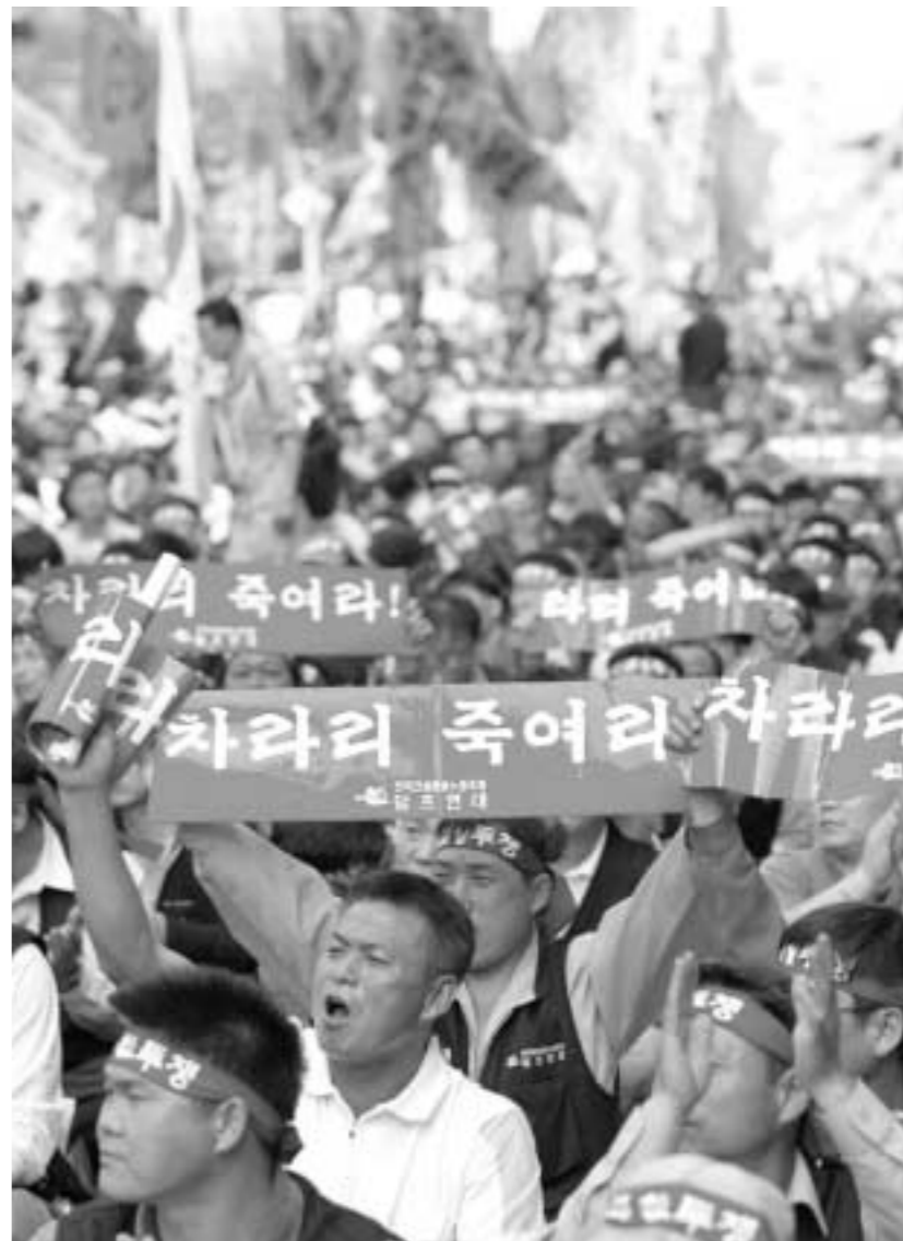
지난 1일 광화문 등에서 열린 115주년 노동자 대회에 죽음보다 처절하게... 서 참가한 노동자들이 정부를 향해 외치고 있다.