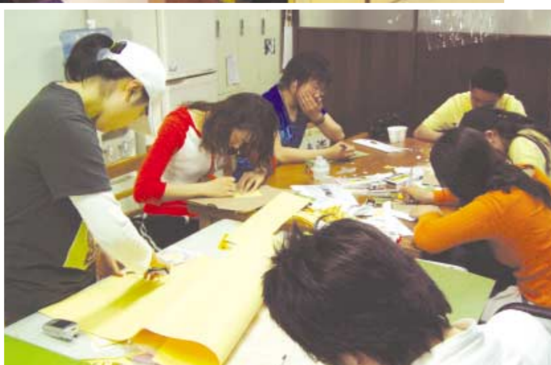
▶ 총학생회가 건설되지 못한 지금, 그래도 각 단과대에서는 오는 5월에 맞춰 여러 행사를 기획하고 있다. 불교대 학생회에서 동불연꽃제를 준비하는 모습이다. 학생들의 열정적인 활동으로 다음 보궐선거에는 총학생회가 건설되길 기대해 본다.