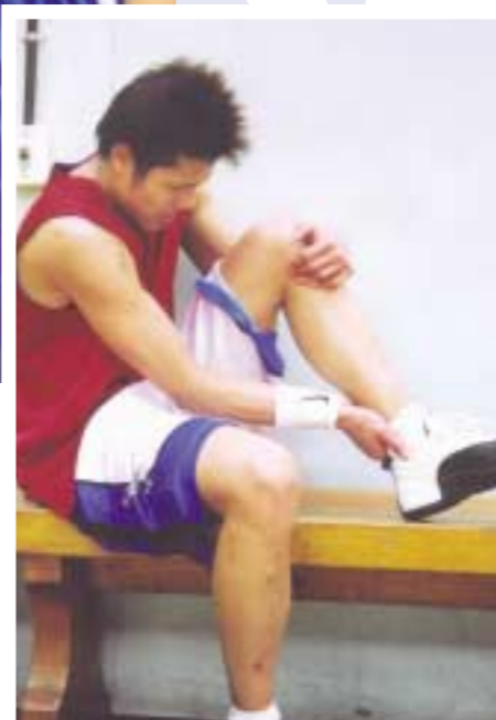
▶ 지금 우리학교 체육관은 과포화상태이다. 운동부원들의 연습 공간도 부족한데 교양수업까지 체육관에서 진행한다. 격렬한 운동 연습으로 다리를 다친 농구부원.