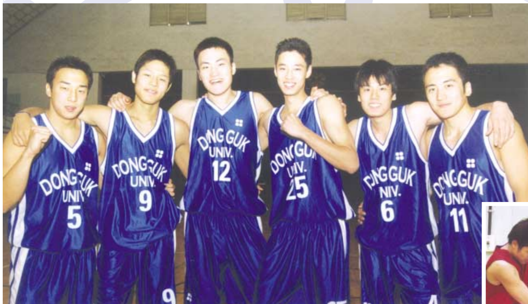
▲ 지난 2003년 전국체전 은메달의 주역인 우리학교 농구부원들. 지금은 비록 몸을 움추리고 있지만 내일은 우승을 향해 뛴다.