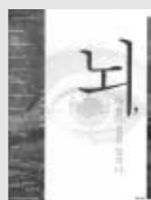
뇌, 아름다움을 말한다 지상현 지음, 해너우, 2005

인간이 예술작품에서 아름다움을 느끼는 원리와 명작으로 평가받는 거장들의 작품이 아름다움을 주는 까닭을 신경미학적으로 분석한 책. 명작은 과학적으로도 아름다움 이유가 있고, 인간은 두뇌활동에 따라 그 아름다움을 느낀다는 것이다. 좌뇌는 긍정적인 상태를, 우뇌는 부정적인 정서를 처리하며 다른 사