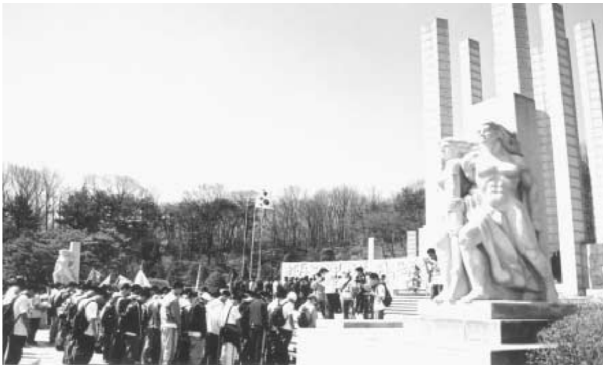
열사를 기리며... 지난달 15일 4·19기념 등반대회가 북한산에서 열렸다. 이날 행사에는 3,200여명이 참가했다. 사진은 등반대회에 참가한 학생들이 4·19탑 앞에서 묵념하는 모습이다. 시상식은 4월 19일 다함관세미나실에서 열렸으며, 전자공학과가 단체별 금상을 수상했고, 4인 1조팀에선 197팀이 수상했다.