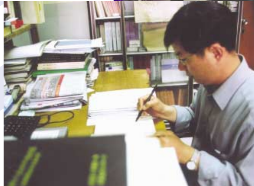
▲ 연구에 몰두하고 있는 북한학 연구소의 한 연구원. 그는 오늘도 학내·외 강의와 연구로 바쁜 나날을 보내고 있다.