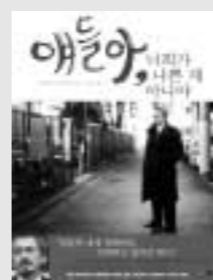
애들이, 너희가 나쁜 게 아니야 미즈타니 오사무 지음, 김현희 옮김, 에이지21, 2005

13년간 밤거리를 배회하며 방황하는 청소년들을 선도하는 '밤의 선생' 미즈타니 오사무. 도둑질, 약물중독, 양파, 폭주족, 폭력조직 가담... 이런 수렁에서 아이들을 끌어내 위로하고 가족의 품으로 돌려보내는 일을 계속하며 때론 위험도 당하고, 심지어 조직폭력배에 손가락을 하나 잃기도 했지만 그 의지는 꺾이지 않는다. 첫머리에 나오는 '팬잖아, 팬잖아'