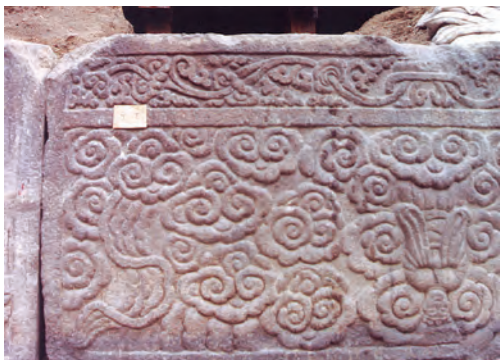
▲ 광통교 남쪽 교대 하단 부재