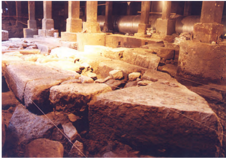
▲ 오간 수문터에서 발견된 수문 기초석