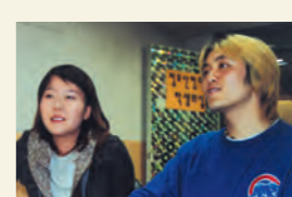
지난 14일 단과대 보궐선거 후보자 등록이 마감됐다. 이에 단과대 입후보자들을 만나 보았다.