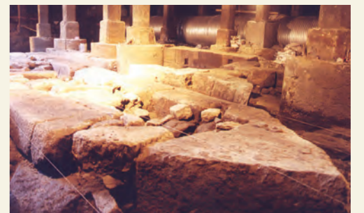
콘크리트에 매몰돼 빛을 보지 못한 편한 600여년 전의 역사 유적들이 모습을 드러냈다.