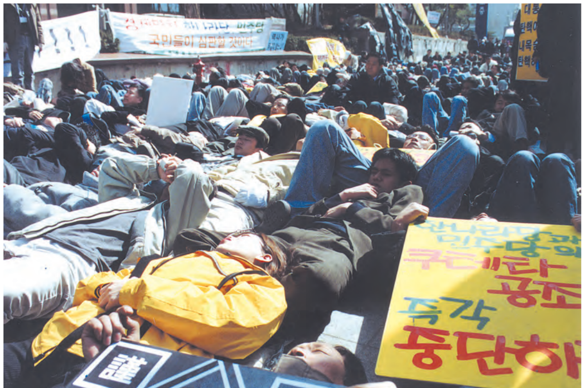
드러누운 심정... 지난 12일 오전부터 '국민의 힘' '노사모' 등 9000여 명의 노동운동 지지자들이 국회앞에 모여 탄핵안 반대 집회를 진행했다. 이들은 탄핵안 가결 소식에 전해지자 아스팔트 바닥에 어깨를 걸고 드러누워 통곡하는 등 격렬하게 항의했다.

△연구처장=박종훈(윤리문화학) △총무처장=정창현(정보관리학) △불교병원개원추진단장=배성현(의학) (이상 3월 1일자) △의료원 기획관리실장=하정운(경영주병원 사무국장) 이진배(이상 8일자) △비서실장=차준환(이상 9일자)이다.