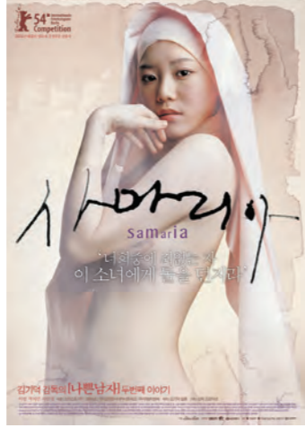
김기덕 감독이 베를린 영화제에서 감독상을 수상한 영화 '사마리아'.

김기덕 감독의 열 번째 영화 '사마리아'는 제목이 풍기는 어감처럼 종교적