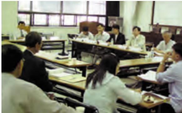
발제에 이어 토론을 진행하고 있는 패널과 청중들.