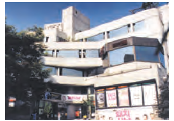
동숭아트센터 2층에 위치한 ‘하이퍼텍 나다’.

이와 관련해 하이퍼텍 나다 영상사업팀 정유정 대리는 “예술영화 제작 및 홍보 등에 대한 안정