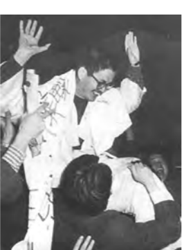
민청학련사건으로 구속됐던 이들이 풀려난 모습.

계 인사와 함께 투쟁할 계획을 세웠으나 그 계획이 정부에 노출됐다. 박정희 정권은 이들의 움직임에 크게 당황한 나머지 긴급조치 4호를 발표하고 235명 구속, 180명 기소했다. 이철, 유인태, 김지하 등 7명에게 사형이 선고됐지만 이들은 10개월이 못되어 전원 석방됐다. 송두율 교수는 민청학련 사건을 계기로 독일에서 ‘민주사회건설협의회’를 발족시켜, 그 때부터 반 체제 인사로 분류됐다. ▲평등사건=79년 3월 1일에 윤보선, 함석헌, 김대중을 의장으로 내세운 ‘민주주의와 민족통일을 위한 국민연합’은 독재정권 타도를 외치며 민주주의와 통일, 그리고 평화에 관한 공약 3장을 내세웠다. 이와 관련해서 정부는 재야의 지도급 인사들이 정부를 전복시키려고 했다는 혐의로 대거 구속했다. 이 사건으로 윤반웅·문익환·함세웅 등 18명이 기소됐고