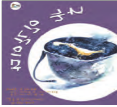
전쟁이야기를 다룬 연극 '나는 인간이다'.

‘나는 인간이다’는 극단 기린이 ‘작은 극장 개관 기념 레파토리 4’로 올린 연극이다. 운명도 필연도 아닌 인류의 영원히 해결되지 않는 문제이지만 그려면서도 너무나 쉽게 잊혀지고 있는 우리의 과제인 바로 ‘전쟁’을 다룬 작품