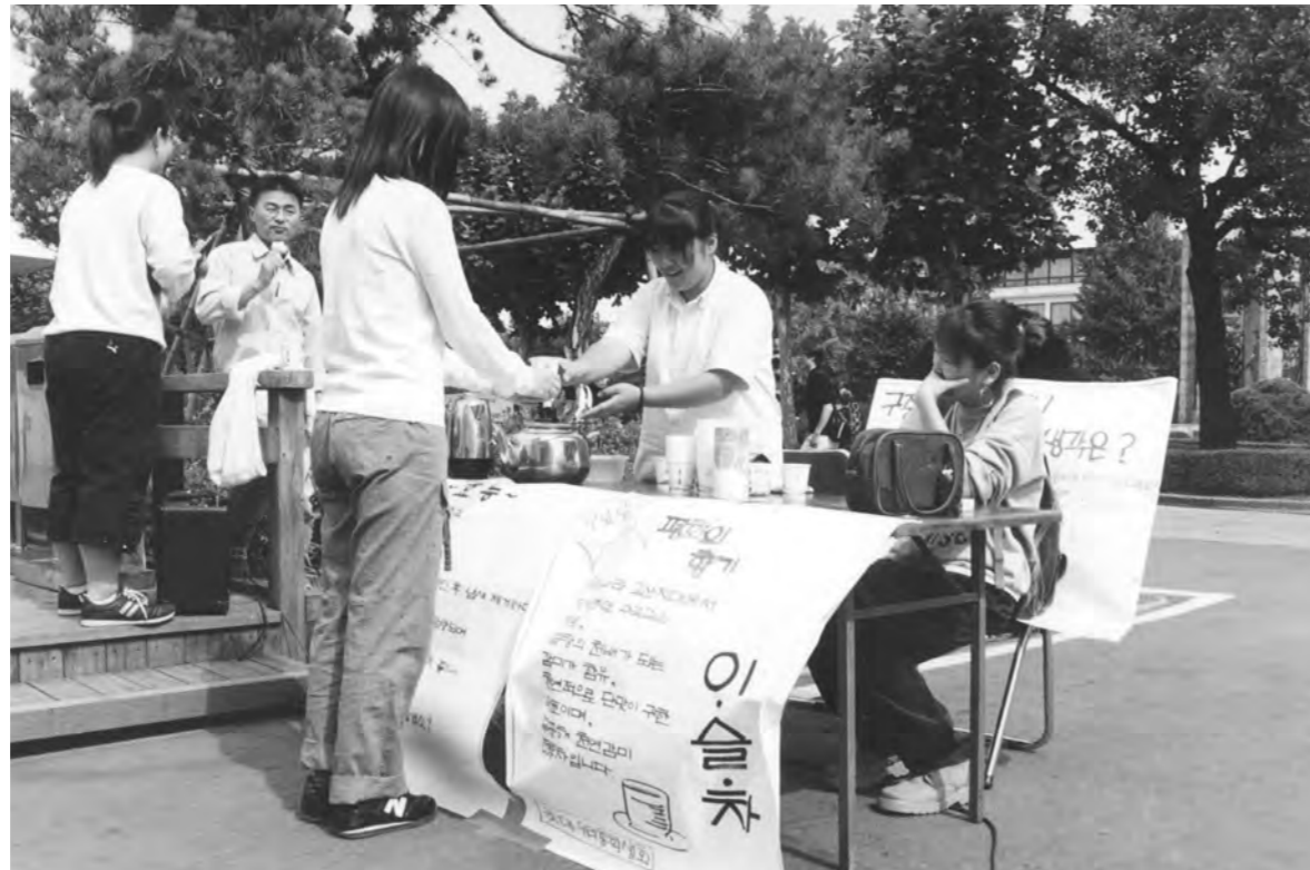
캠퍼스 '문화카페' ... 학내 문화공간 마련을 위한 '아외카페'가 지난 24일 중앙도서관 앞에서 진행됐다. 이날 총학생회는 학생들에게 차를 나눠 주었으며, 앞으로 공영 동아리와 함께 매주 수요일 이 행사를 진행할 예정이다.