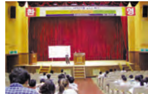
지난 22일 진행된 ‘예비취업자들의 권리...’ 강연회.

취업 준비생이 원하는 것은 취업 그 자체가 아니라 사회 초년생으로서 성공적으로 세상을 살아가는 일이다. 때문에 자신의 권리를 정당하게 주장하고 자신을 효율적으로 관리하는 능력을 키우는 일은 분명 토익점수를 올리는 것만큼이나 중요할 것이다. 졸업준비위원회(위원장=현재형)가 지난 22일부터 사흘간 진행한 ‘자신있는 사회진출을 위한 강연회’