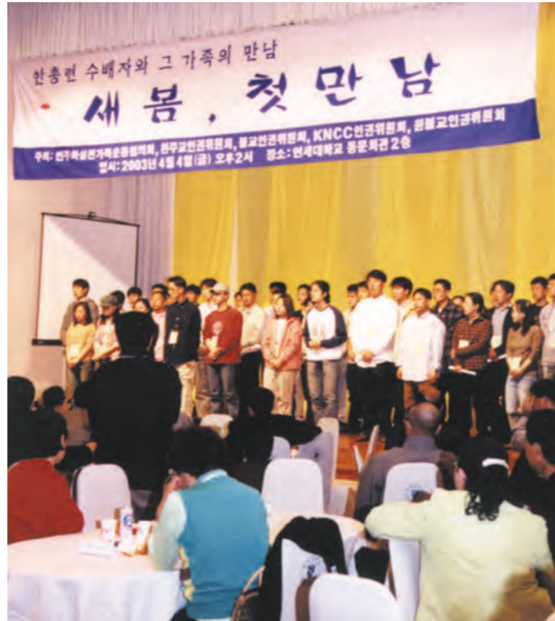
한총련 수배자와 그 가족의 만남, '새봄, 첫 만남' 행사가 지난 4일 연세대학교 동문회관에서 진행됐다. 민가협과 불교인권위원회 등 4개 종교 인권단체 주최로 열린 이번 행사는 눈앞에 집을 두고도 오랜 시간 생이별을 해왔던 이들의 애절한 만남의 자리가 됐다.