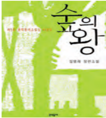
생태주의 서사문학으로 자연에의 외경을 표현한 김영욱의 '숲의 왕'.

오늘날 생태 환경이 위협받고 있다는 것은 새삼 말하지 않아도 누구나 다 알고