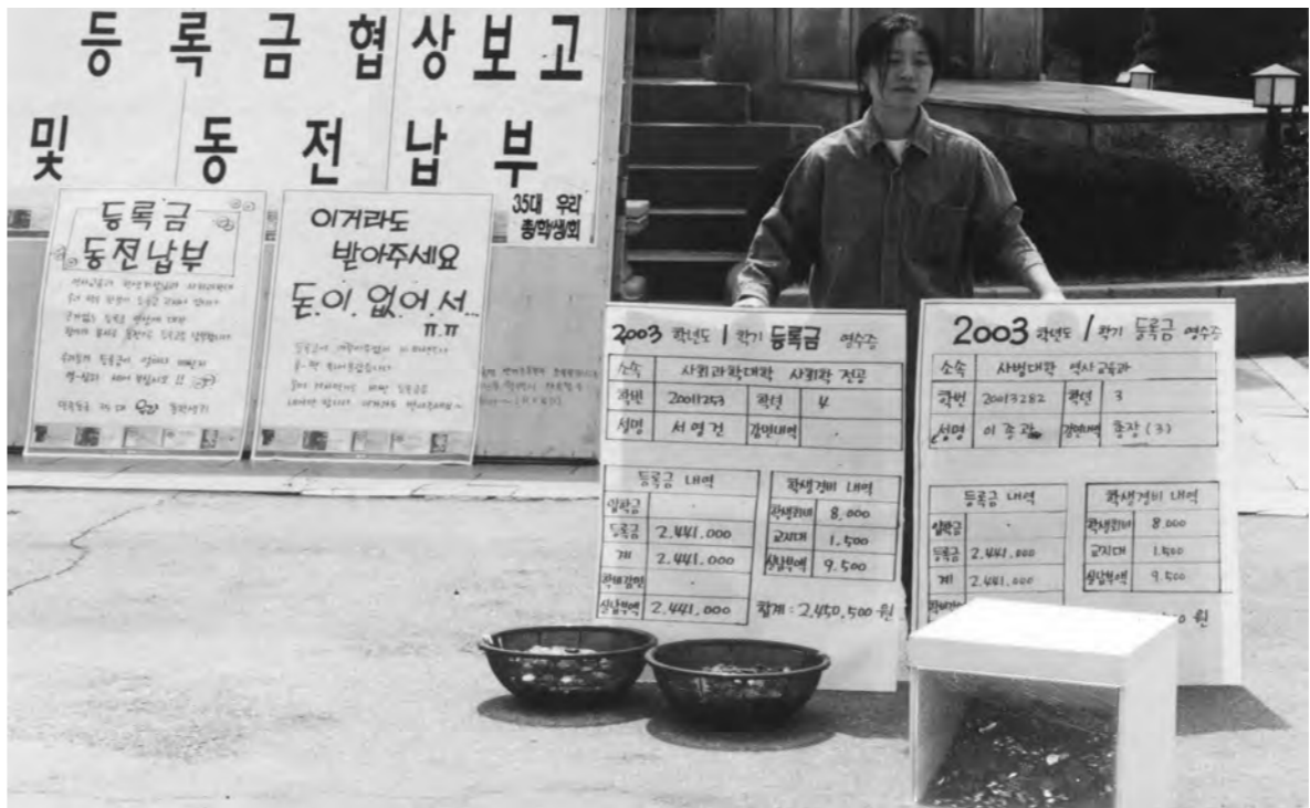
의미있는 동전 ... 총학생회가 지난 4일 근거없는 등록금 인상에 반대하며 두 학생의 등록금 전액을 동전으로 납부했다. 이에 앞서 불상 앞에서는 지난 3일 등록금 인상을 8%에 대해 학교측과 논의한 내용을 보고하는 자리를 가졌다.

그러나 근본적인 문제는 이러한 논란이 사전에 후보자와 선관위가 서로 대화를 통해 해결할 수 있는 문제였다는 점이다. 따라서 앞으로 중선위와 후보자측은 상시적으로 만나 논의할 수 있는 기구를 구성해 원만한 선거진행을 해야 할 것이다. >관련기사 3면(해설보도) >조슬기 기자