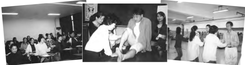
◆ 취지 : 학내에서 공강시간을 이용하여 정서함양과 교양습득에 도움이 되는 문화서비스를 받을 수 있는 기회