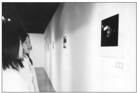
사진 동아리 '동그라미' 제14회 신인전 ... 신선한 작품 세계 돋보여

최근 찍은 사진을 바로 볼 수 있는 디지털 카메라가 대중화되면서 사진 찍는 사람들을 곳곳에서 쉽게 볼 수 있다. 이처럼 디지털 카메라에 익숙해진 신세대들에게 수동 카메라는 낯선 골동품일지 모른다. 하지만 수동 카메라로 찍은 흑백 사진의 매력에 흠뻑 빠져 있는 사진 동아리 '동그라미'의 회원들에게 그것은 '보물 1호'이다. 지난 3일부터 5일까지 갤러리 동국에서 동