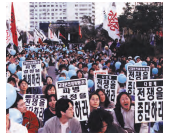
‘대학생 행동의 날’ 행사가 지난 4일 종묘에서 진행됐다.