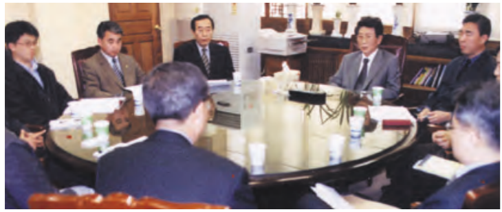
학교측과 학내 구성원 대표가 모여 학교현황에 대한 논의를 진행했다.

학교, “민주적 절차 따라 결정할 것” ... 학생, “명확한 인상요인 요구”