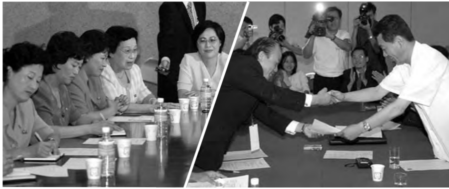
지난 8월 민족공동행사 중 부문별 상봉모임을 가진 여성대표들(왼쪽)과 청년대표들(오른쪽).