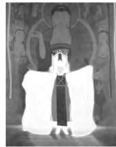
대상 수상작 '열반'