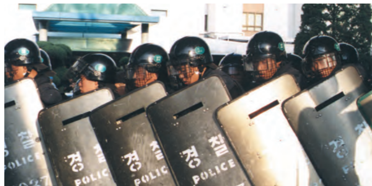
흔히 '전경'으로 불리는 집회진압 기동대원들.