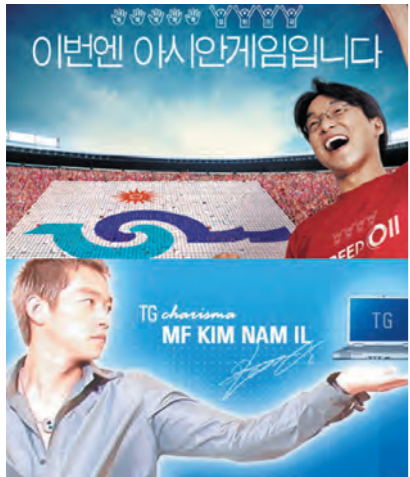
지난 월드컵의 열기를 이어가고 있는 'SK텔레콤'과 '삼보컴퓨터'.

2002년 6월 한달 동안 국민의 관심을 집중시켰던 월드컵이 막을 내리고, 9월 말부터 부산 아시안 게임이 남북화합을 과시하며 진행되고 있다. 최근 들어 TV에서의 스포츠 열기는 하나의 커다란 트렌드를 만들어내고 있다. 광고업계에서도 스포츠에 대한 사랑은 아주 각별해서 야구, 골프, 축구, 농구 등의 스포츠 스타들은 그들의 경기장에서만이 아니라 이제 TV 프로그램 사이사이에서 또 다른 모습으로 사람들의 시선을 모으고 있다.