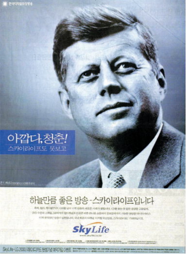
다채널·쌍방향 서비스를 내세우는 디지털 위성방송 스카이라이프.

지난 1일 디지털 위성방송이 본 방송을 시작함에 따라 적도 상공의 3만5천800미터에 떠 있는 위성을 통해 깨끗한 품질의 방송을 즐길 수 있게 되었다.