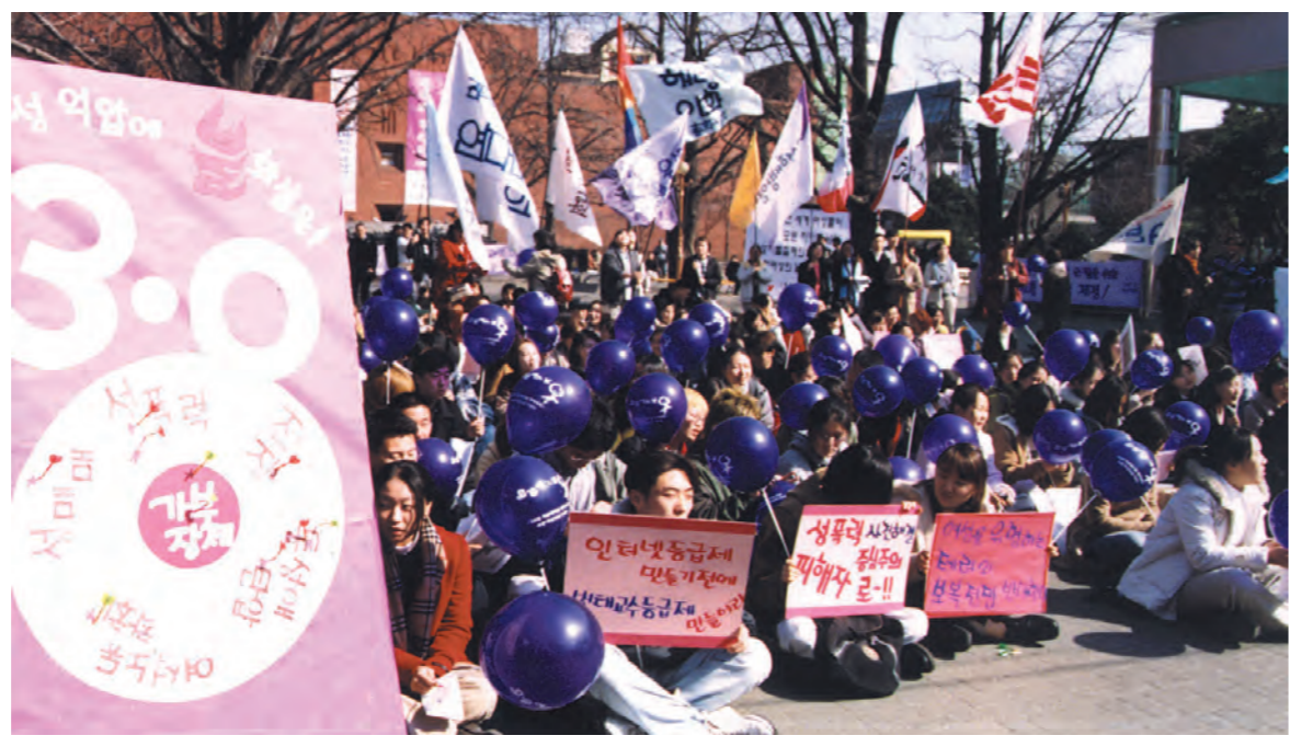
오늘 만큼은... '3·8일 여성의 날 투쟁대회'가 지난 8일 대학로 마로니에 공원에서 열렸다. 이날 참가자들은 여성을 상징하는 보리색 풍선을 손에 들고 어느 때보다 소리를 높여 구호를 외쳤다.