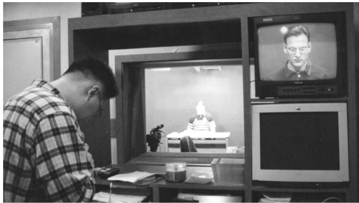
학림관 3층 교육매체센터에 마련된 사이버 스튜디오에서 동영상 강의 제작이 진행중이다. 제작된 동영상 강의는 이번 학기부터 가상강좌 '대학기초영어'를 통해 시범 실시될 예정이다.