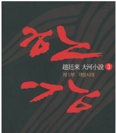
조성래의 세 번째 대하소설 '한강'.