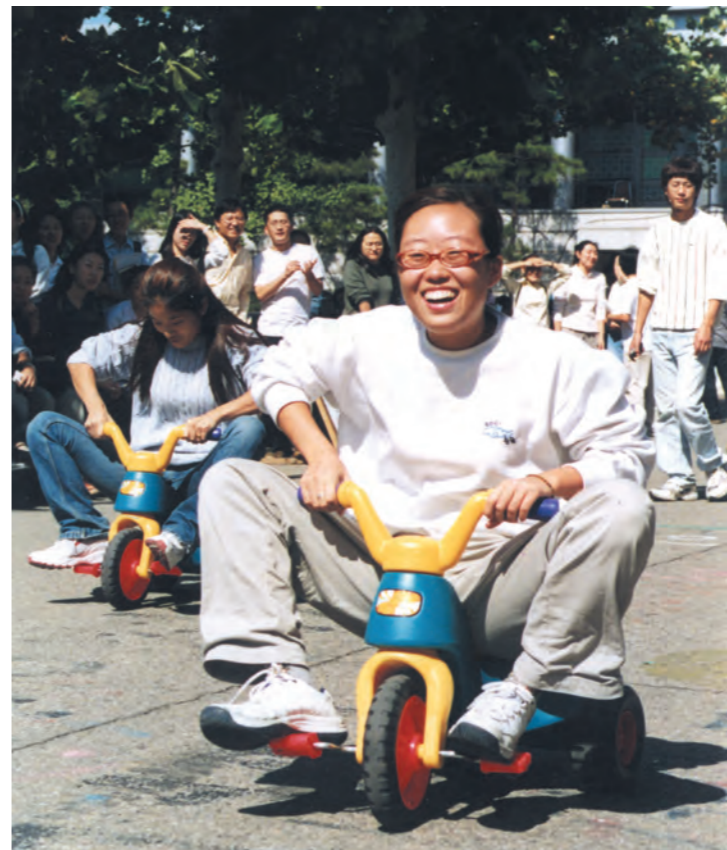
"달려!"... "따르릉 따르릉 비켜나세요~" 지난해 27일 열린 한기위한 미당 행사중 학생들의 눈길을 끈 세발자전거대회. 힘껏 페달을 밟으며 결승점을 향하는 승자의 환한 표정과 생각만큼 잘 되지 않아 당황하는 여학생의 대조적인 모습이 인상적이다.

행사는 오전 9시 개회식을 시작으로 △식후행사 및 각 단과대별 스탠드 이동(오전 10시~10시 30분) △단체 출발기 예선(오전 10시 30분~11시 30분) △축구 결승(오전 11시~오후 12시) △단체 출발기 결선(오전 11시 30분~오후 12시) △점심 시간 및 홀라후프 경연대회(오후 12시~1시) △100/400M 예선·교직원 학생대표 축구대회(오후 1시~2시) △100/400M 결선·마라톤 출발(오후 2시~3시) △인간 탄환(오후 3시~3시 30분) △OX 퀴즈 및 행운권 추첨(오후 3시 30분~5시) △폐회식 및 시상(오후 5시~5시 30분) 등으로 진행됐다. 한편, 구기 종목 예선은 오는 12·15일 양일간 치러지며, 축구를 제외한 나머지 종목의 결선은 16일 열릴 계획이다.