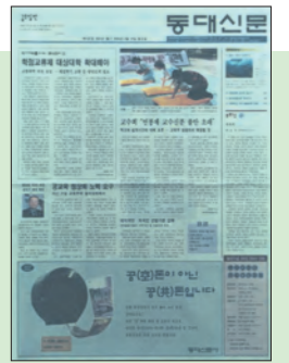
(제1327호 9월 24일자)