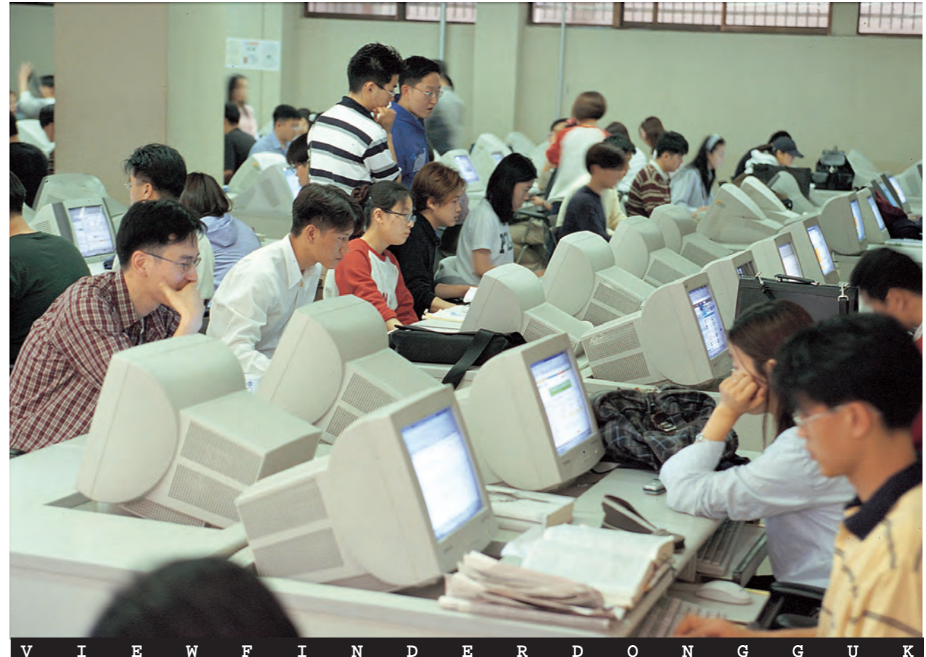
정보의 바다로... 그곳에 가면 나만의 공간이 펼쳐진다. 새 얼굴로 단장한 동국관 BSC실이 학생들의 열기로 가득차 있다.