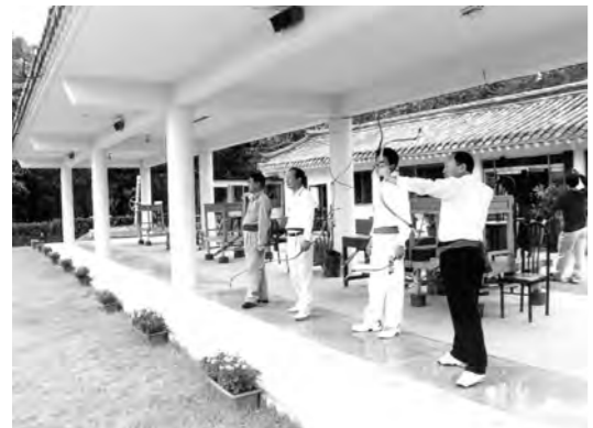
전통무예동아리 '동궁'의 활쏘는 모습.