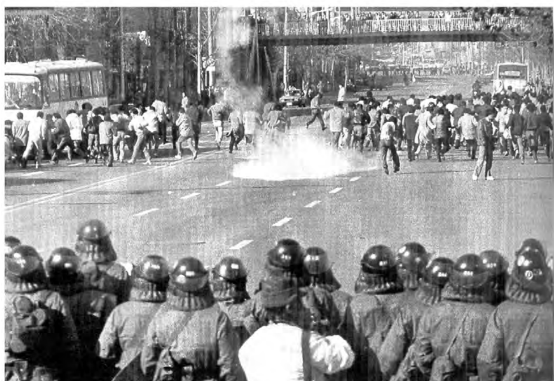
87년 11월 29일 ... 서대문 부근에 몰려있던 시민들이 경찰의 최루탄 발사로 흩어지고 있다.