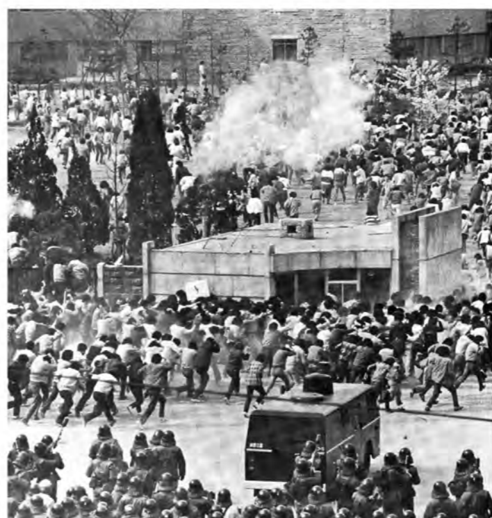
85년 4월 20일 ... 연세대에서 대학생들이 교문밖으로 나오자 경찰과 충돌했다.