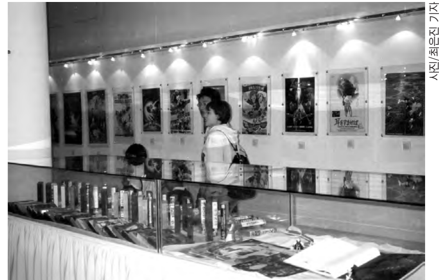
서울랜드 이벤트홀의 만화영화박물관, 만화영화 캐릭터인형과 포스터 등이 전시.

만화는 더 이상 저급한 문화가 아니다. 기발한 창의력과 작품성으로 승부하는 새로운 예술장르로