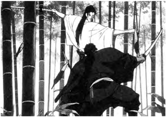
가와지리 요시아키 감독의 히드고어 작품 '무사 쥬베이'.

일본대중문화 3차개발 결정으로 일본 극장용 장편 애니메이션이 국내에 본격적으로 개봉되기 시작한다. 특히 국제영화제에서 수상한 작품에 한