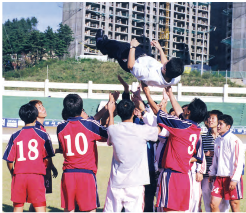
축구부가 지난달 27일 결승전 경기 후 행가래를 하며 우승의 기쁨을 나누고 있다.

한편, 총동창회(회장=권노갑)는 지난달 27일 엠버서더 호텔에서 많은 관계자들이 참석한 가운데 축하연회를 열어 감독과 선수들을 격려했다.