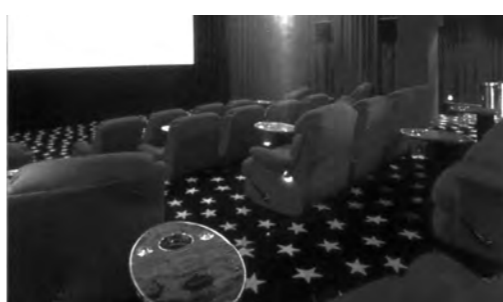
고급영화관을 표방하는 오리(OGV11)의 골드 클래스관

'영화를 즐기는 제2의 동물원'이라는 뜻의 'ZOONOOZ(주공공이)'나 영화를 통해 '나는 나다'라고 말할 수 있게 한다는 '하이퍼텍 나다'는 영화관의 이름을 색다르게 짓는 것과 동시에 의미를 부여하는 것에서 차별을 꿈꾼다. ZOONOOZ의 경우는 극장 경영을 강제규사단의 (주)강제규필름이 맡고 있다. 이는 단지 극장에 영화를 거는 일에서