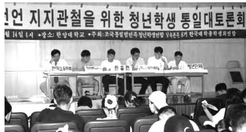
지난 8월 14일 통일단체의 대표들이 참여한 가운데 '통일대토론회'가 열렸다.

그러나 민화협은 6·15 공동선언이 갖는 여러 가지 의의에도 불구하고, 군비축소문제와 전쟁방지를 위한 평화체제를 구축해 나가는 과정에 이를 뒷받침해 줄 수 있는 조치가 미흡했다는 점을 한계로 지적하며, 또 다른 문제로 통일운동이 정권연장의 수단으로 둔갑하여 민간주도에서 정부주도로 돌변해버릴 가능성이 많다는 우려도 나타내었다.