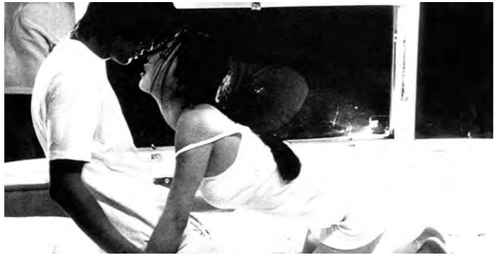
몸으로 만나 몸으로 이야기하는 영화 '미인'의 한 장면.

극영화에서 배우의 몸은 드라마의 재료이자 스펙터클의 기능을 해왔다. 불완전한 상상력으로서의 영화, 관습 파괴적인 영화 만들기에 천착해 온 여감독은 '몸'이란 소설을 썼고 그걸 '미인'이란 영화로 만들었다. 그리고 배우의 몸을 사건의 중심이자 화두로 설정한다.