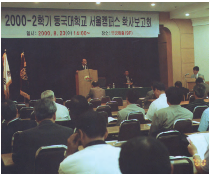
지난 23일 양명 한학콘도에서 서울캠 학사보고회와 전체교수회의가 열렸다.

한편, 영상정보통신대학원과 불 교문화대학원이 신설되며 정원은 각각 50명과 20명이다.