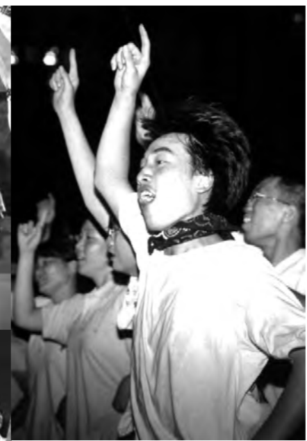
통일노래가 나오자 참가자들은 옆 사람들과 서로 춤을 추며 어울렸고 밤이 새는 줄도 모르고 모두 하나가 되어 즐겼다.