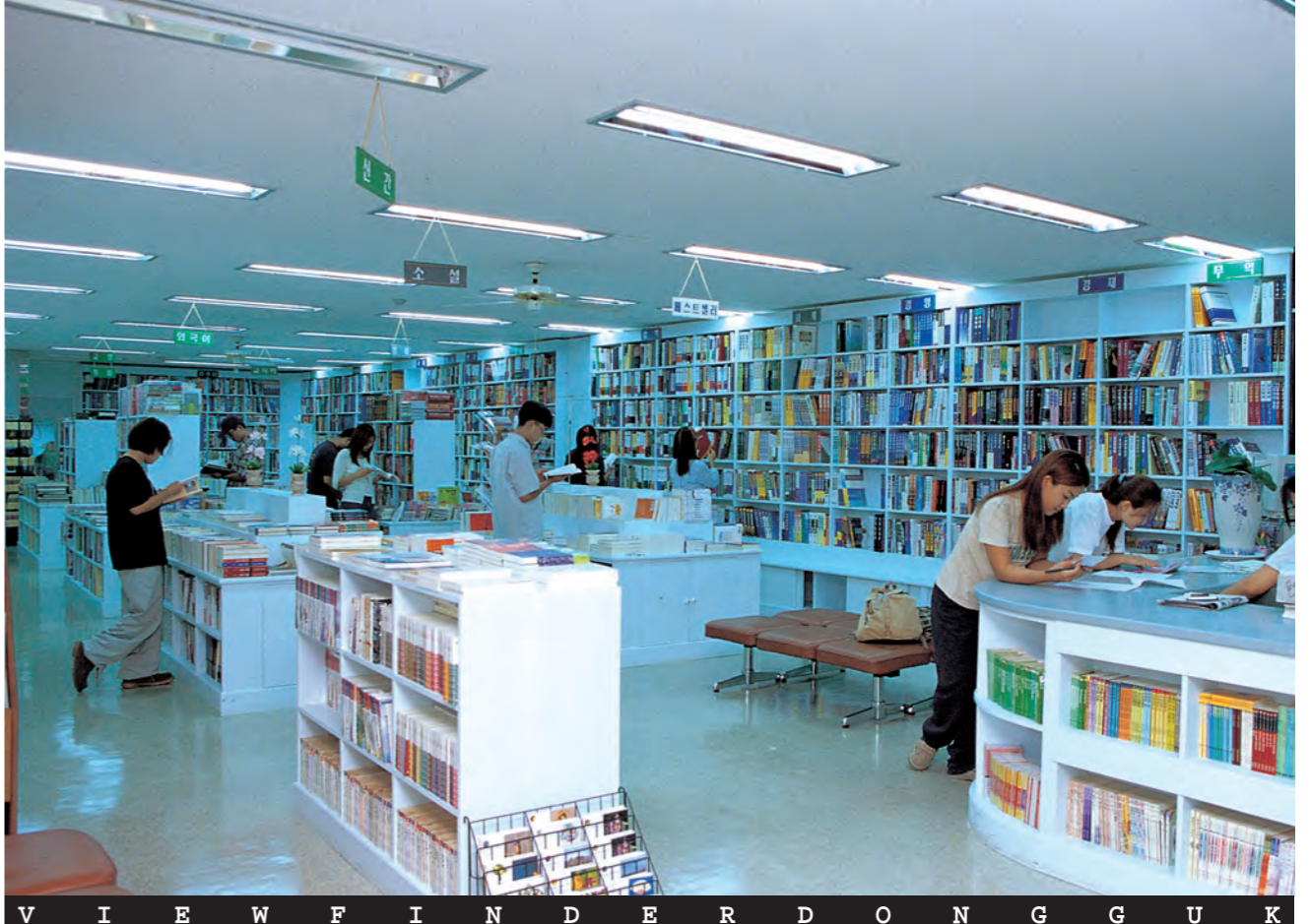
책의 향기... 개강을 맞아 학생들로 붐비는 서점. 새롭게 단장한 다양한 서점처럼 학생들도 새로운 다짐을 ...

가 줄지 않을까... 봉투가 필요하면 돈 주고라도 사게된다. 하지만 반납이 되지 않으면 그 봉투는 다시 쓰레기가 된다. 이것도 수익사업으로 하는것이면 100원 받아도 살 사람은 다시나간 100원 받지 왜 30원만 받는지 모르겠다. 거스름돈 70원으로 쓸데도 없는데. 하여튼 생협에서는 조치를 취해서 봉투 판매를 하더라도 반납을 받는다는 문구를 써 붙여야 할것이다. 쓰레기를 줄이면서 반납이 안된다면 이런 모순이 어디에 또 있을까? 제가 바라는 것은 학생들에게 봉투사용 자제와 반납을 선전하고 실천하자는 것이다. 김중환(jhkim93@dgu.ac.kr)