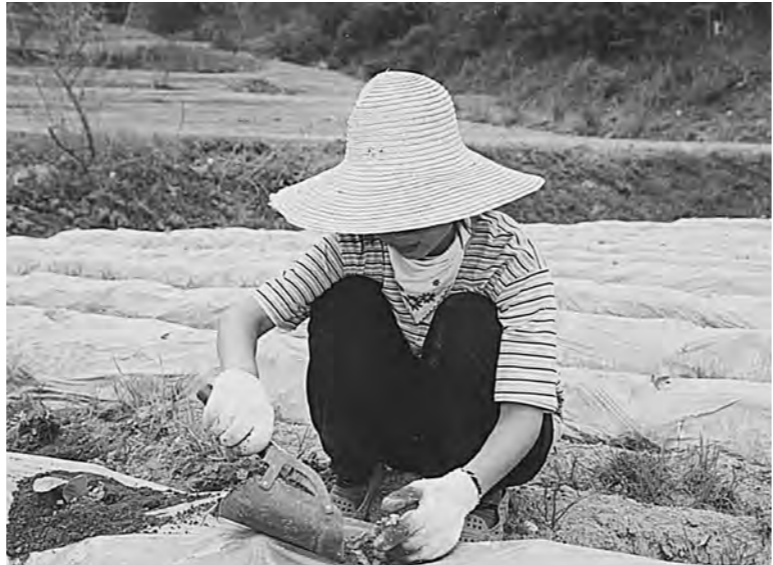
봄농활... 2000년 봄농민학생연대활동(이하 농활)이 지난 4일부터 7일까지 총북 체전에서 진행됐다. 총학생회 주최로 농민의 어려움을 함께 나누고자 진행된 이번 농활은 60여명의 학생들이 농사일에 참여하며 자연과 함께 마음껏 숨쉬는 시간을 가졌다.

이와 관련해 학생복지실의 한 관계자는 "갈수록 사제간의 정이 메마르는 것 같아 아쉽다"며 "이번 행사를 통해 따뜻한 마음을 주고받을 수 있는 계기가 됐으면 좋겠다"고 전했다.