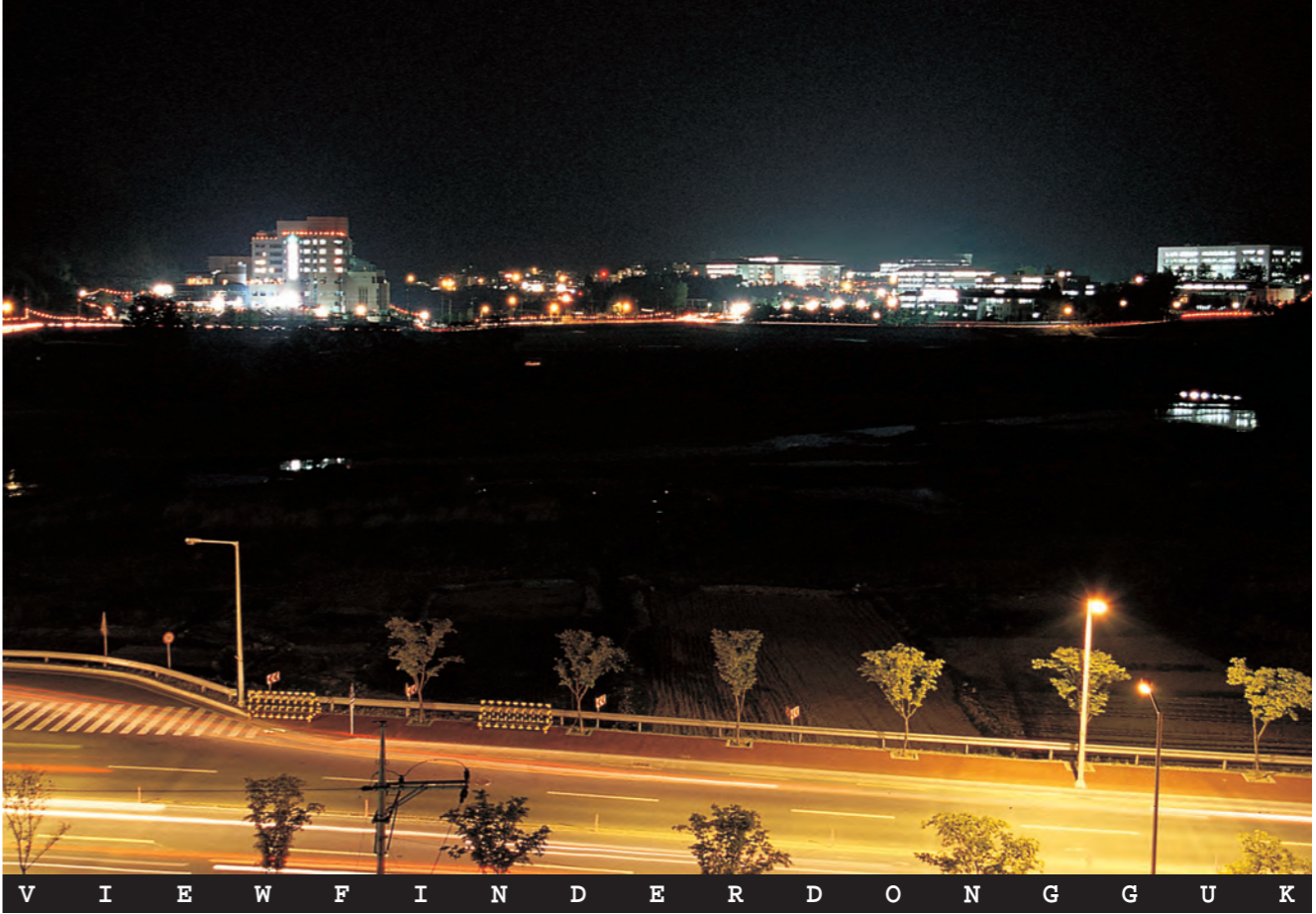
부처님의 자비와 광명이 누리의 어둠을 밝히시니, 형상강 너머 온방골이 피안인듯 아름답다. 아제 아제 바라아제 바라승아제...

언제 생각지도 모르는 자리를 남에게 배려해 주기 위해 필요한 때만 자리를 잡자는 얘기가 아니다. 공부를 시작하게 되면 메모 한 장을 남기는 미덕을 갖자는 것이다. 덩그러니 놓인 책가방 때문에 기억 없는 메모기(?)가 된다는 것은 참으로 애석한 일이다. 약간의 배려가 받는 사람에게는 커다란 고마움이 된다. 생긋한 메모 한 장이 심심한 입을 달랠지도 모른다. 실컷 어려운 메모기(?)라면 온방골의 장미 빛 로맨스를 펼칠 수 있는 기회일런지는 아무도 모른다. 최중보(인문대 학문4)