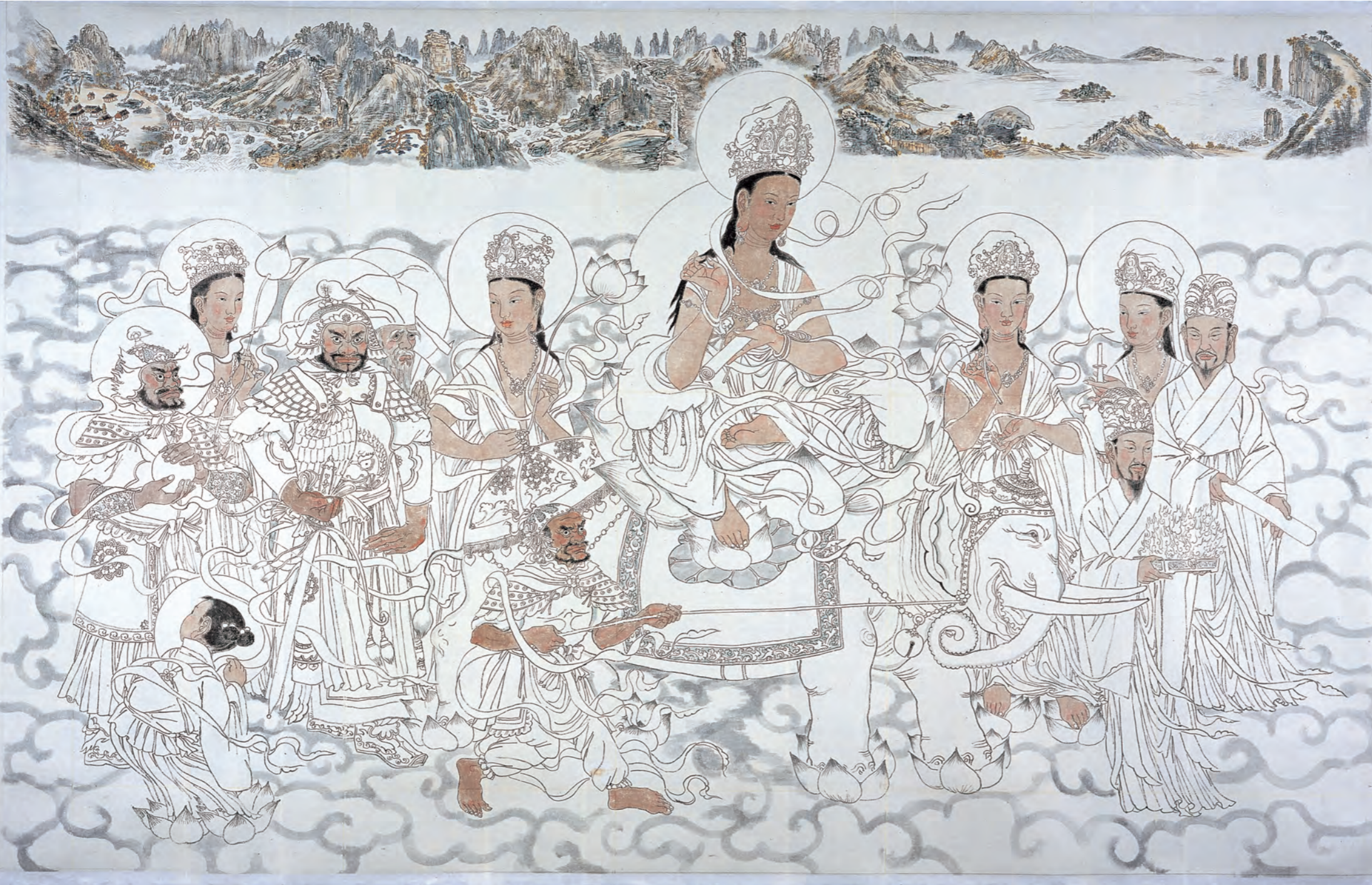
문수보살 금강산 현시도

희망찬 새천년에 문수보살께서 백두대간의 중심인 금강산을 통해 내려오셔서 불국정토로 통일을 이룩해 내신 모습