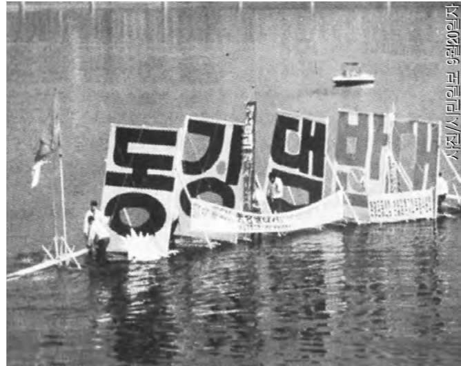
지난해 12월 한강에서 뱃목시위를 하고 있는 환경연합회원들과 동강주민들의 모습.