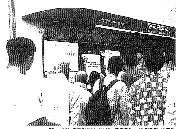
공부합시다... 지난 18일 출근위에서 실시한 모토의 시범결과 발표회 학생들의 눈길을 끌고 있다. 그러나 타대학과 비교해 짧은 막대그래프는 비비보다는 이의 일가에 한숨이 절로 나오게 한다.