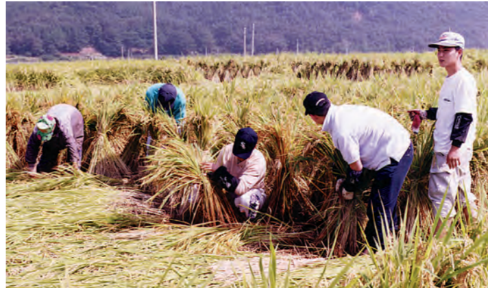
이번 봉사활동을 계기로 경주캠은 지역중심대학으로 거듭나는 계기를 마련했다.

에게 도움을 받게 돼 감사하게 생각하고 앞으로 지역사회와 동국대 간의 유대관계가 더욱 돈독해졌으면 한다”고 전했다. 이날 봉사활동을 통해 석장·현곡일대에 피해를 입은 24만여명의 쓰러진 벼 가운데 9만여명의 벼를 일으켜 세워 40%의 복구작업을 마쳤다. 이날 참가한 학생에게는 15시