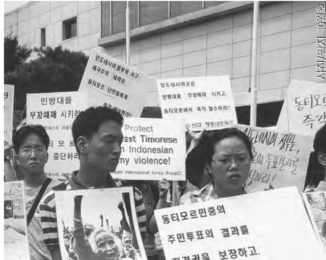
지난 13일 서울 여의도에서 '동티모르 대학살중단과 동티모르인의 자결권 보장'을 촉구하는 한국시민사회단체의 연대집회 가 열렸다.