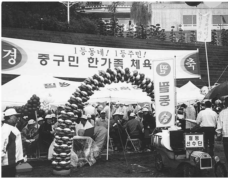
1등주민... 중구민들의 날을 맞이하여 지난 2일 본교 서울캠 대운동장에서 중구민 한가족 체육대회가 열렸다. 양경인 기자