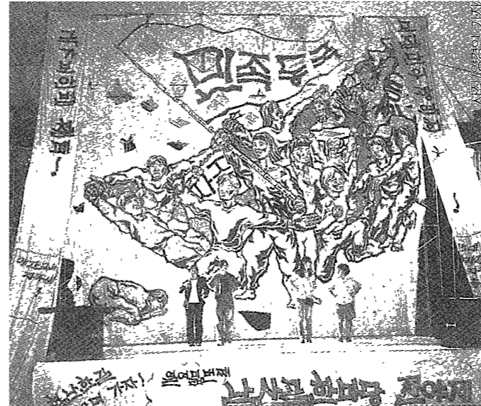
지난 30일 이종의 '보신굴 한마당' 전야제를 시작으로 이번주 본격적인 학술제와 체전이 진행될 예정이다.

대동제는 '21C 공대생의 창업 전망'이라는 주제의 초청강연회도 열린다. 정산대 정산대 비상대책위원회(위원장=김진수·컴퓨터정보통신공학2)는 오는 6일부터 8일까지 △농구, 줄다리기대회: 6일-7일 △네트워크 게임대회(스타크래프트): 컴퓨터 공학전공 실습실 △DDR(DANCE DANCE REVOLUTION)대회: 정보문화관과 학생회관, 계산관 앞 공터 등지에서 '99정보문화축전'을 진행한다.