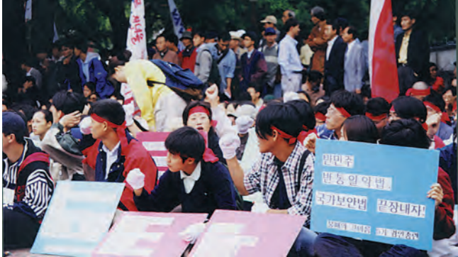
지난 2일 마로니에 공원에서는 국보법철폐와 BK21 철회를 위한 청년학생투쟁대회가 열려 이후 정부당국과의 미담이 예상된다.

정부·여당의 국가보안법 개정 움직임과 최근 발표된 BK21사업 등의 여파가 아직도 지속되고 있는 가운데 오는 10월 8일과 9일 기점으로 학생운동 진영의 대대적인 대정부 투쟁이 전개될 예정이다. 관심이 모아지고 있다.