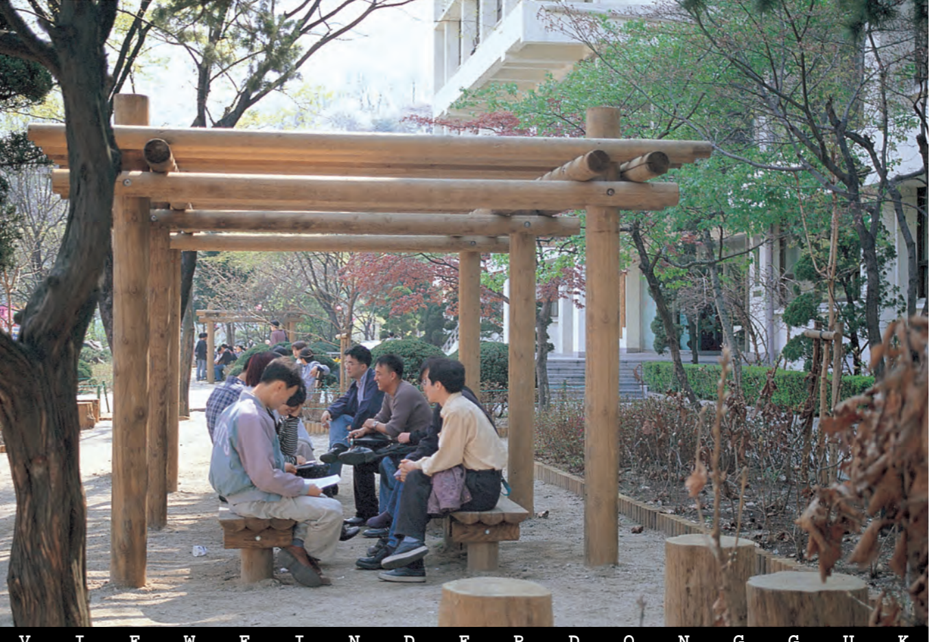
오순도순... 가을학기도 중반에 접어들어 궤도에 올랐다. 하지만 강의시간 틈틈이 모여 앉아 헌담하는 재미도 쏠쏠하다. 한 무리의 남학생들을 웃게 만드는 공통의 화제는 무엇일까?

현재 동국관 1 동 2층에 위치한 어학원에 관해서 시정조치 해주셨으면 해서 이렇게 글을 올립니다. 현재 학생들이 오디오 테이프나 비디오 테이프를 빌려 보는 과정에서 A4용지로 되어있는 책자를 학생들이 보고서 직접 작성하고 있는데, 그 책자가 거의 너덜너덜해져서 볼 수가 없을 정도입니다. 그리고 목록이 적혀있는 책자를 관리하지 못하겠으면 컴퓨터로 개발해서 검색할 수 있도록 해서 찾는 사람도 편하고 관리하는 사람도 편하게 했으면 합니다. 그리고 신규구입을 한다고 학생들보고 적으라고 했던 비디오 테이프나 오디오 테이프들이 정말로 들어왔는지 1학기 때하고 전혀 변한 것이 없더군요. 언어교육원이면 새로운 정보를 접해서 최신의 테이프와 교재를 구비했으면 좋겠습니다. 김찬호(전신통계4)