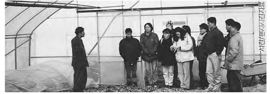
한국불교환경교육원은 생태학교를 열어 일반인을 위한 환경교육을 실시한다.

구체적으로 살펴보면 매년 봄, 가을에 생태학교와 생명운동아카데미를 열어 일반인과 전문인을 위한 환경교육을 실시하고, 전문가 양성을 위한 교육프로그램인 생명운동 작은대학을 개최한다. 연구조사