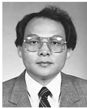
문 일 수 의과대학 의학과 해부학교실

연구소는 유전자가 조작된 감자로 쥐를 사육한 결과, 쥐의 주요 장기의 손상, 면역 기능 약화, 뇌의 축삭등 충격적인 연구결과를 발표하였다.