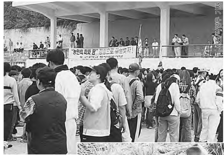
지역사랑을 스스로 실천하려는 4천여명 온방골 학생들이 인근 농촌으로 떠나기 위해 모여있다.

지만은 않다. 주최측은 “지역발전과 봉사차원에서 필요 한 일이지만 지속적인 요구는 들어주기 힘들 것”이라는 입장. 학생들은 “농민을 이해하고 노동의 소중함을 깨닫게 되는 계기가 되었다”고 말하는 쪽이 있는 반면 일부는 “공부하러 왔지, 일하러 왔는가. 남의 일에 신경을 만큼 한가지는 않다”는 입장이다. 또, 수혜자 역시 “아직 손 불 논이 많은데도 오후 5시쯤에 모든 학생들이 돌아가서 아쉽다”고 하는가 하면 “학생들을 맞이하기 위해 점심식사를 많이 준비했는데 적게 오는 바람에 손해만 봤다”며 방법상의 문제점에 대해서도 지적했다. 명분만 있다고 해서 모든 일이 성공적으로 치러지는 것은 아니다. 철저한 준비와 과정속에서 진정한 참여만이 명분 이상의 성과를 가져오는 것을 잊어서는 안된다. “이번 행사는 어떤 의미로 다가올 것인가. 시도했다는 만족감, 어느 정도의 일을 성취했다는 것에 대한 만족감 등등, 그러나 남을 위해 자신을 희생할 봉사정신이 진정한 우리 가슴속에 남아 있었을까” 다음에 또 이런 기회가 온다면 아쉬움보다 만족감이 남았으면 하며, 진실된 마음으로 참여하는 봉사활동이 되었으면 한다. “학교측의 강압으로 인해 어쩔 수 없이 갔다”는 등의 말이 안 나오게. 황성규 기자 dream@mail.dongguk.ac.kr