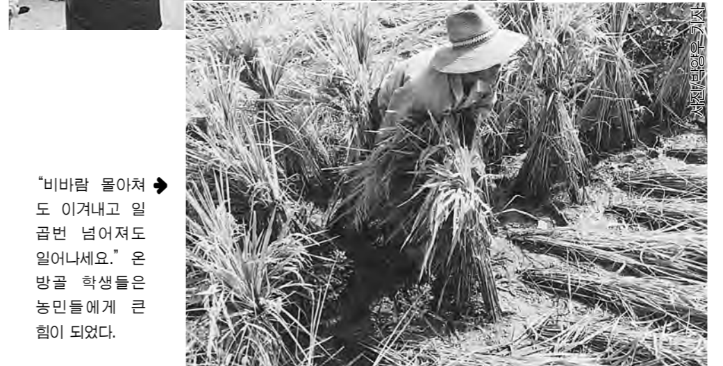
“비바람 몰아쳐도 이겨내고 일 끝낸 넓어져도 일어나세요.” 온방골 학생들은 농민들에게 큰 힘이 되었다.