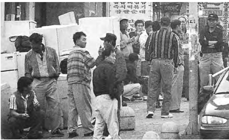
건축경기가 살아나기만을 비리고 있는 일용직 노동자들이 모여있는 새벽 인력시장. 일용직 노동자들은 산업재해나 임금체불을 당하고도 업체로부터 보상을 받지 못한다.

이러한 가운데 지난 3월, 사상 처음으로 한라중공업 사내하청노동조합이 결성돼 비정규직 노동자 스스로 "하청노동자도 인간"임을 말하고 권익 보호를 위한 본격적인 투쟁을 준비하고 있다. 그러나 정부에서 노조 설립 필증이 나오자마자 하청노조 간부들이 일했던 몇몇 업체들이 한라중공업으로부터 '계약폐기' 형식으로 정리되는 등 부당한 처사는 계속되고 있으며, 지난 8월 한라중공업이 현대중공업에 위탁 경영되면서 하청노동조합원들은 대부분 해고된 상태이다. 현재 진행중인 한라중공업 노조파업에는 해고된 하청노동자들도 동참하고 있으며, 이번 파업은 비정규직 노동자와 정규직 노동자 간의 연대와 사내하청노조의 영향력