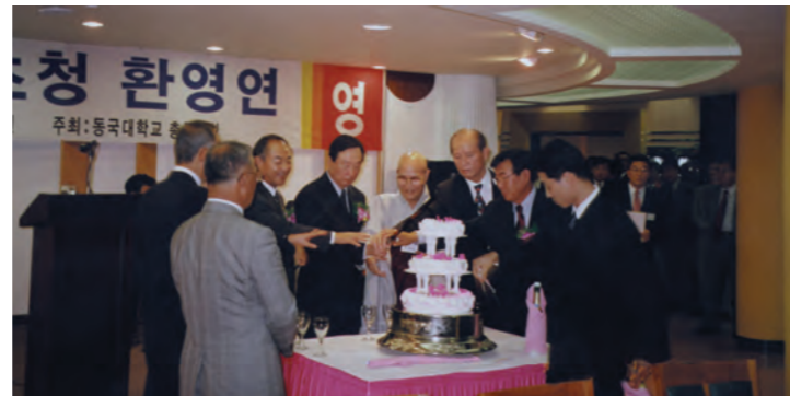
지난 1일 서울캠 상록원에서는 북미주 동문 초청 환영연이 열려 동국발전의 의지를 느꼈다.

뉴욕, 남가주, 샌프란시스코 등 북미 동문들이 모교를 방문, 동국발전의 결의를 다졌다.