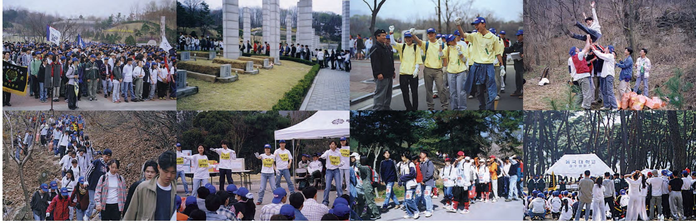
민족동국의 4·19 ... "이승만은 하이히라." 독재와 부정으로 얼룩졌던 이승만 정권의 퇴진을 가져온 4·19혁명. 그리고 그 최선두에 섰던 동국인들. 올해도 어김없이 민족동국은 선배들의 정신과 뜻을 기리며 서울캠과 경주캠에서 각각 등산대회를 진행했다. 이날 행사는 양캠에서 모두 4천5백여명이 참가하는 등 성황리에 개최됐다.

4·19혁명 39주년을 기리는 제 30회 동국인 등산대회가 북한산 일대에서 열렸다. 교수, 직원, 학생 등 3천여명이 참가한 가운데 진행된 이번 대회는 참가자들이 오전 9시 수유리에 위치한 4·19 국립묘지에 집결, 4·19혁명 기념식을 갖고 각 팀별로 출발했으며 진달래능선을 지나 대동문, 행궁지를 경유해 북한산성 매표소로 내려오는 코스를 등반했다.