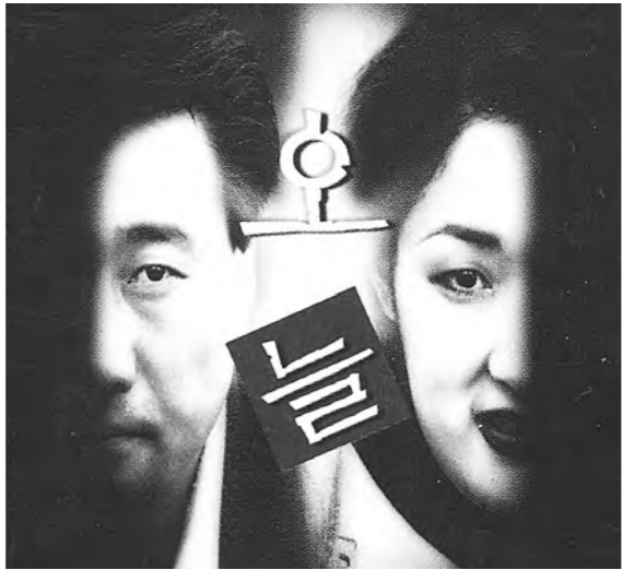
'오늘'은 작가가 건네주는 우리시대 욕망에 대한 항체이자 역군제이다.

“중요한 것은 이야기 자체가 아니라 그것을 재구성하는 작가의 극정신과 극형식, 그리고 그 의미이다.”