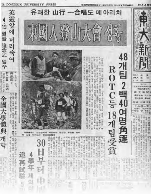
4·19 기념등산대회 첫시작을 알린 동대신문(1970년 4월23일자)

고려대는 4·18 구국대장정 ... 유신시절, 학생시위로 '왜곡' 탄압하기도