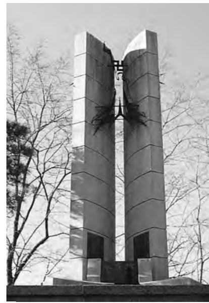
4·19 희생 열사 추모 '동우탑'