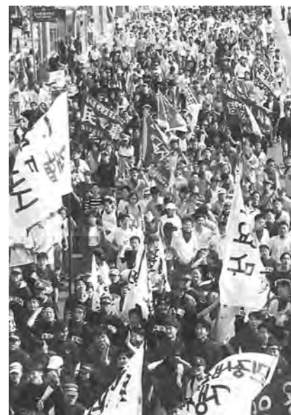
고려대의 '4·18 구국대장정' 마라톤 대회