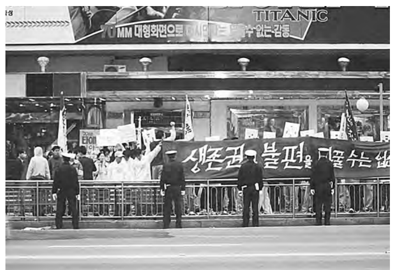
총학은 지난 13일 열린 민족통일대회이후 총무로 일대에서 '한총련대의원대회 보장과 이적규정 철폐'를 위한 가두시위를 벌였다. 대한극장 앞에 모인 학생들이 대시민선전전을 진행하고 있다.

이번 협의와 관련해 학생처와 총학의 관계자는 "서로 의견이 맞지 않는 사항들도 있었지만 요구사항에 대해서 많은 검토와 내부 논의를 거쳐 이번 합의를 만들어냈다"고 긍정적인 평가를 내렸다.