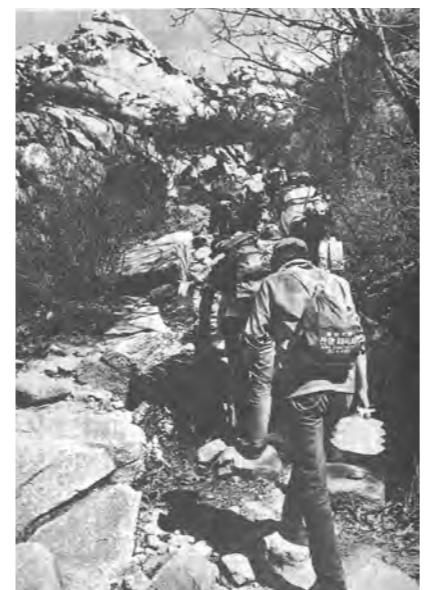
본교의 '4·19 기념 등산대회' 모습.