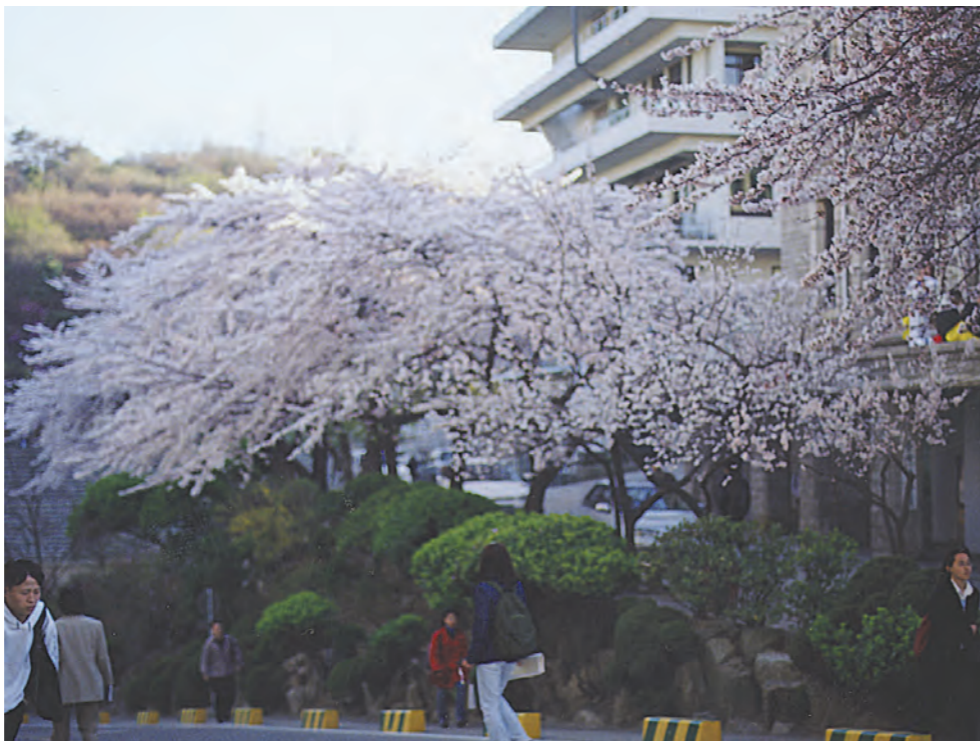
만발한 벚꽃이 꽃이며, 네가 입김으로 / 대낮에 불을 밝히면 / 환히 금빛으로 열리는 가정자리(김춘수 '꽃의 소모' 중) 사진은 서울캠 우체국앞