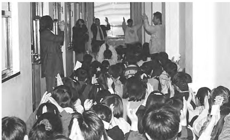
학자투 선포식후 학생들이 본관에서 항의농성을 벌이고 있다.