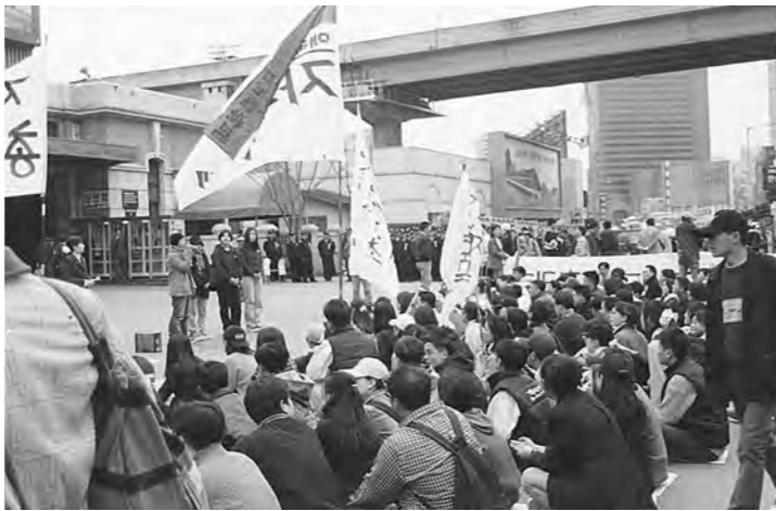
사진은 서울역에서의 마무리집회 모습이다.

전국여대생대표자협의회(이하 전여대협)는 지난 19일 용산미군기지 앞에서 '오부처 게이조 방향 반대, 사대매국정권 퇴진, 주한미군 철수'를 위한 총궐기 대회를 개최했다.