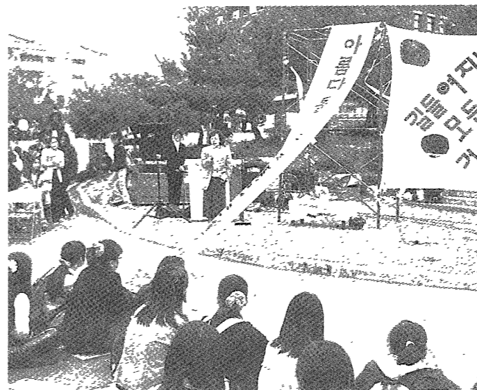
시작... 지난 18일 백상탈 앞에서 있었던 총학생회 출범식 사진. 상경대를 시작으로 14개의 단대 및 자치기구의 출범식이 잇따라 개최될 예정이다.