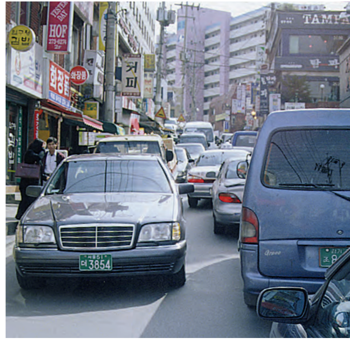
녹두사거리에서 후문으로 올라오는 길은 양방향으로 자동차가 가득차 있어 사람들이 다니기에 위험스러운게 사실이다.