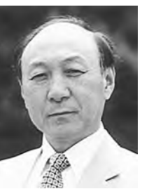
임기중 문과대 국문학부 교수

재할 수 있다고 강조하면서 대화와 토론을 한다. 그뿐 아니라 그들은 밍티엔과 오늘은 매니매니 다르다고 생각한다. 그리하여 그들은 우리의 오늘이 있지만 내일은 없을 수도 있다고 생각한다. 그들에게 있어서 오늘과 내일은 매니매니 다른 것이다. 그래서 그들은 컴퓨터와 인스턴트 식품도 만들어내고, 시간은 황금이라는 속담을 만들어내기도 하였다. 도화원기에 나타난 도연명의 이상향은 물질을 긍정하고 물질을 추구하는 것이지만, 토머스 모어의 유토피아는 물질을 부정하면서 정신적 건강을 지향한다. 물질이 부족하면 행복은 물질에 있으나, 물질이 풍성하면 행복은 정신적 건강에 있는 것이다. 취직이 안되면 행복이 취직에 있을 것 같지만, 취직이 되고나면 행복은 여유로운 삶에 있을 것이다. 그러나 우리들의 삶의 지향점은 오히려 그런 각기 다른 상황논리의 틀에서 벗어나 미국과 중국이 공존한다는데서 찾아보아야 하는 것이 아닐까.