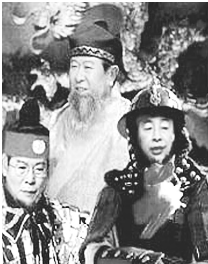
“애 이국통일이러도 돼야 삼국통일이 되지”

현재 패러디가 선풍적인 인기를 끌고 있는 것은 그것이 기존 우리 사회의 통념을 자극적이면서도 유쾌하게 깨기 때문이다. 패러디는 독립적인 창조의 양식이다. 그렇기에 패러디는 청출어람(靑出於藍)해야 한다. 기존의 것을 모방하는데 그친다면, 또한 그 모방이 조롱과 아우에만 그친다면 그것은 어설픈 흉내에 지나지 않는다.