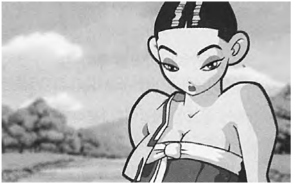
애니메이션은 결코 만만한 사업이 아니다. 키우기만 하면 쑥쑥 황금알을 낳아주지 않는다.

“재능과 창의력이 유입되지 않는 한 첨단산업의 미래는 없다. 정말로 시급한 것은 애니메이션계의 구조조정이다.”