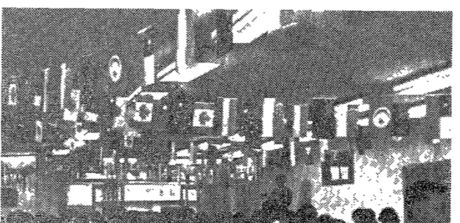
▲ 중소기업에서의 Marketing 활동. 기획, 전략수립, 제품개발, 판매촉진 등 다양한 활동을 하고 있다.

마케팅이란 무엇인가? 라는 질문에 대한 정답은 나오지 않고 있다. 그러나 최근 몇 년 동안 마케팅의 역할과 중요성이 급속히 증가하고 있다. 특히 중소기업에서 마케팅은 생존을 위한 필수적인 요소가 되었다.