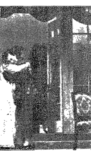
전통극 공연 모습

본 기사는 전통극의 현대적 재해석과 비정형극의 발전 가능성에 대해 다룬다. 전통극의 장점을 현대적 감각으로 재창조하는 것이 중요하다고 본다. 비정형극은 관객에게 새로운 경험을 제공하고, 사회적 문제를 더 깊이 있게 다룰 수 있다. 이를 통해 드라마의 사회적 기능을 강화할 수 있을 것이다.