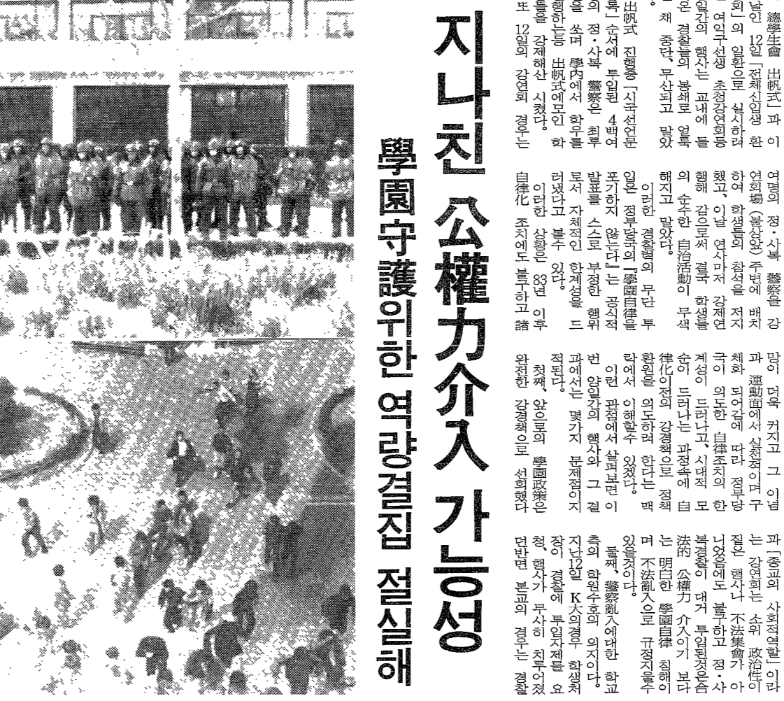
11·12일 양일간 경찰투입 해설. 서울대학교 학생들의 시위 모습. 경찰의 투입으로 상황이 진정되었지만, 학생들의 불만은 여전히 남아 있다.