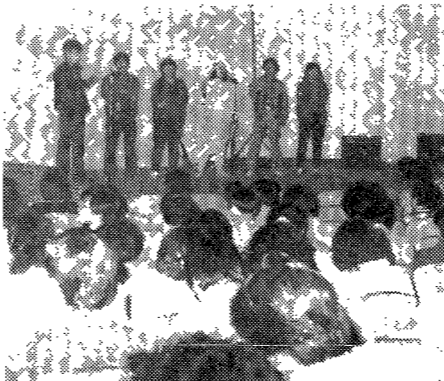
▲지난 14일 오후 5시부터 3일째 신입생 환영행사가 소강당에서 열렸다.

첫날 초청연사 강제연행 둘째날 강사문제로 또 연기 14일 노랭근이로 행사 마쳐