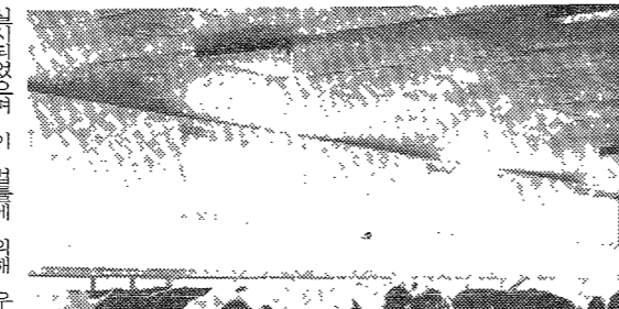
우유를 생산하는 젖소

우유 공급 정책의 개선이 필요하다. 선진국 우유 공급국이 우유를 수출하는 국가들에게 우유를 공급하는 선진국 우유 공급국으로 인정받고 있다.