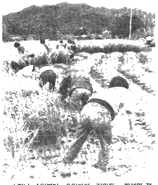
▲지난 4일부터 6일까지 강원도 횡성면 평리에서 가을농촌현황이 있었다.