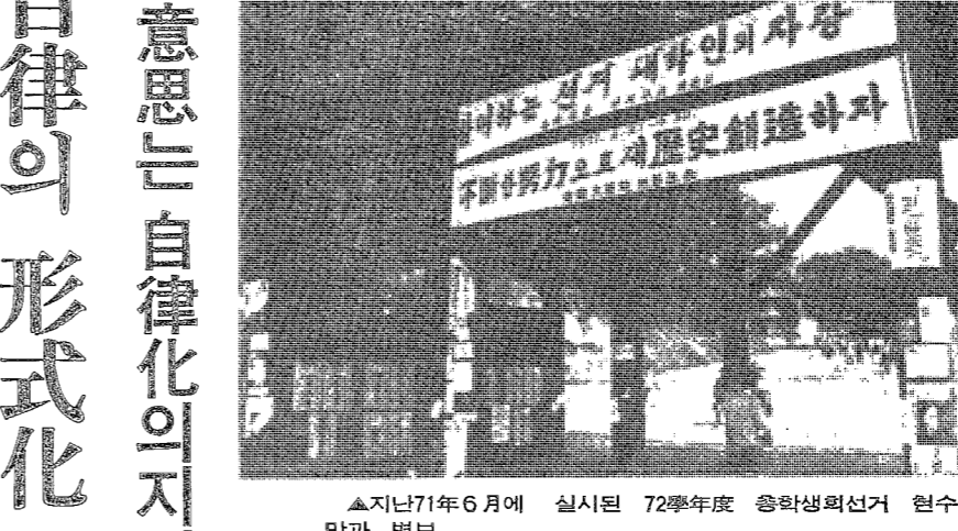
▲지난 71년 6월에 실시된 72학년도 총학생회선거 현수막과 현수막

대학생회 부활이냐 아니냐에 대한 관심이 뜨겁다. 학생회 부활을 둘러싸고 학생들 사이에서 찬반이 갈라져 있다. 학생회 부활을 찬성하는 이들은 학생회 부활을 통해 학생들의 권익을 보호하고, 학교 생활을 개선할 수 있다고 주장한다. 반면 반대하는 이들은 학생회 부활이 학교 생활을 더 복잡하게 만들고, 학생들의 부담을 늘릴 것이라고 우려한다.