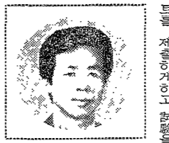
大學南道의 某 氏의 肖像

誤差와 過誤의 차이점은 무엇인가? 이 두 개념은 어떻게 구분되는가? 誤差와 過誤의 차이점은 무엇인가? 이 두 개념은 어떻게 구분되는가?