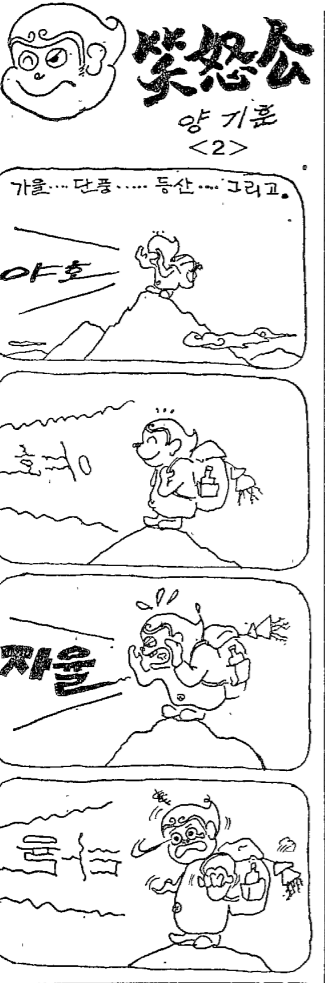
笑怒소 양기운 <2> 가을... 단풍... 등산... 그리고...

韓國 資本主義와... 朴玄燮 著 『民族經濟論』 『民衆과經濟』 이 책은 저자 박玄燮 씨가 목사의 부채로서의 민중이라는 자리에 서서 사회와 민중을 어떻게 바라볼 것인가를 다룬다.