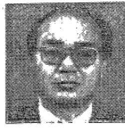
〈著者〉 李 大 南

행정적 규제는 대학의 창의적 발전을 저해하는 요소이다. 대학은 자유로운 비판 정신을 생명으로 여겨야 한다. 이는 대학의 질적 하락을 막기 위한 대책이 필요하다. 이 대책은 대학의 질적 하락을 막기 위한 대책이다.