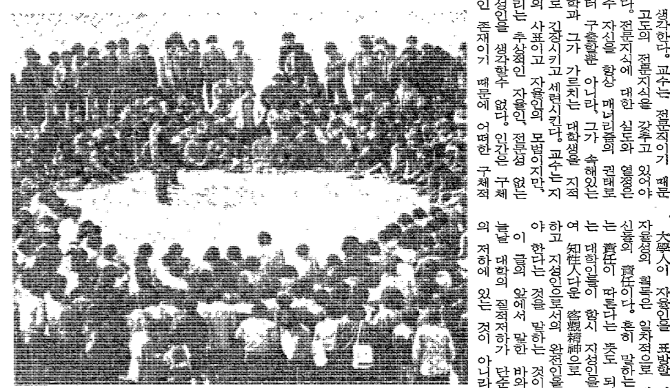
대학의 질적 하락을 막기 위한 대책을 논의하는 회의 모습이다.

대학은 사회의 선진문화를 창조하고, 인재를 길러내는 기관이다. 그러나 최근 들어 대학의 질적 하락이 우려되고 있다. 이는 대학의 질적 하락을 막기 위한 대책이 필요하다. 이 대책은 대학의 질적 하락을 막기 위한 대책이다.