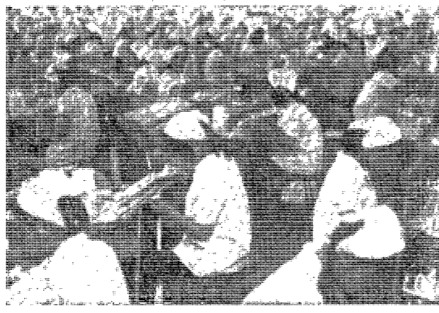
▲자녀를 돌보는 어머니의 모습.

본 논문에서는 자본주의 체제 하에서 발생하는 상대적 빈곤의 원인을 분석하고, 이를 해결하기 위한 방안을 모색하고자 한다. 특히 자본주의의 본질적인 모순인 '생산의 사회적 성격'과 '생산수단의 사적 소유' 사이의 모순을 중심으로 살펴보겠다. 자본주의 체제 하에서는 생산수단이 사적으로 소유되고, 생산은 사회적 성격이 있다. 이로 인해 생산의 사회적 성격과 생산수단의 사적 소유 사이에 모순이 발생한다. 이 모순은 자본주의 체제의 근본적인 모순이다.