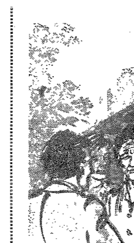
한글의 원형과 발달

자존심 자극하는 전포사의 웃음 자존심을 자극하는 전포사의 웃음. 현대인들의 마음을 사로잡는 유쾌한 이야기이다.