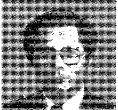
金 時 배