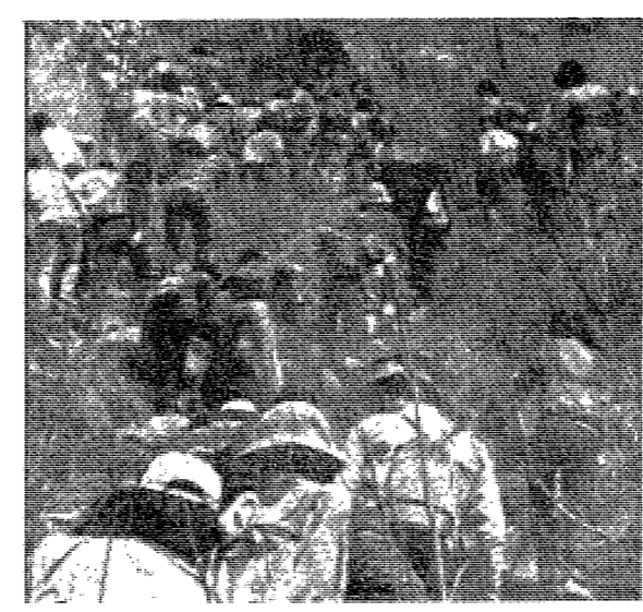
4.19를 기념하고 동국인의 단결을 보여주는 동산대회가 지난16일 있었다.

4백70여팀 2천여명參加 總長賞은「통계과」3년B팀「차지」 東大新聞社主催の「東國意志 大進山行」が、4月16日北漢山一帯で行われた。参加者は470以上、2000人以上に達した。総長賞は、統計科3年Bチームの「차지」が獲得した。