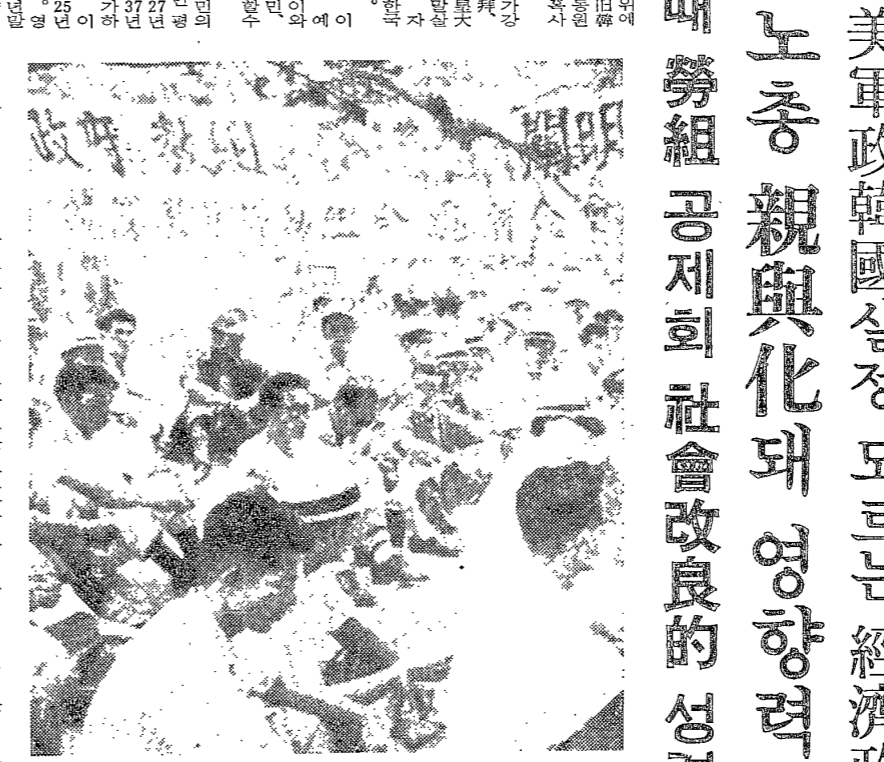
1960년 7월 3일 대우시 임원시정에서 열린 회의의 모습