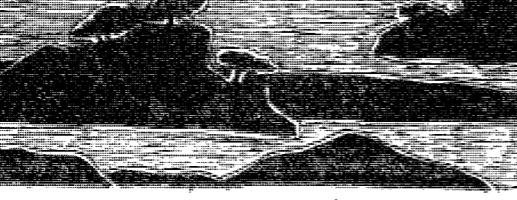
< 佛 大 · 山 崎 島 >

乙 瀨 島 是 一 個 宜 人 的 地 方 。 乙 瀨 島 是 一 個 宜 人 的 地 方 。 乙 瀨 島 是 一 個 宜 人 的 地 方 。