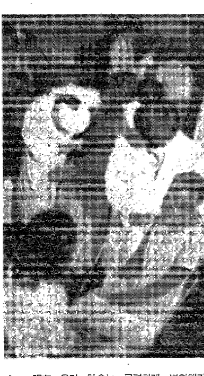
현재 우리 학생들은 어떤 생활을 하고 있는가

대학에서 어떤 학과를 선택할 것인가는 학생의 인생을 좌우하는 중요한 결정이다. 이 결정은 단순히 현재의 흥미나 사회적 요구에 따라 이루어져서는 안 된다. 학생은 자신의 재능, 성격, 그리고 미래의 진로에 대해 깊이 고민해야 한다.