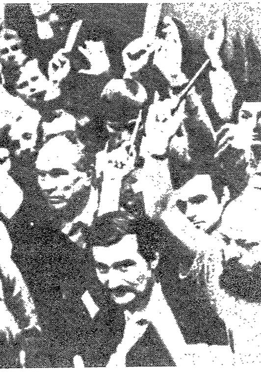
波충동사태 打開는 自國 노력의 功績

중동 지역의 지정학적 중요성은 미국과 소련에게 있어 전략적 가치를 지닌 핵심 지역이다. 미국의 '화해정책'은 중립국을 포용하여 중동 안정을 꾀하는 데 초점을 맞추고 있다. 반면 소련은 중동에서 자신의 이익을 극대화하려는 정책을 펴고 있다. 폴란드의 사태는 이 냉전적 대립의 한 단면으로, 양측의 외교적 움직임이 지역 정세에 미치는 영향을 주목해야 한다.