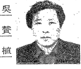
吳贊植 <소설가, 평론가>

1. 生活의 小問題 吳贊植의 문壇론은 '生活의 小問題'에서 시작된다. 그는 문壇이 사회의 단면을 반영하고, 작가의 개인적 체험을 바탕으로 해야 한다고 주장한다. 문壇이 단순히 문예적 유희에 그치지 않고, 현실을 비판하고 사회를 개선하는 역할을 해야 한다고 강조한다.