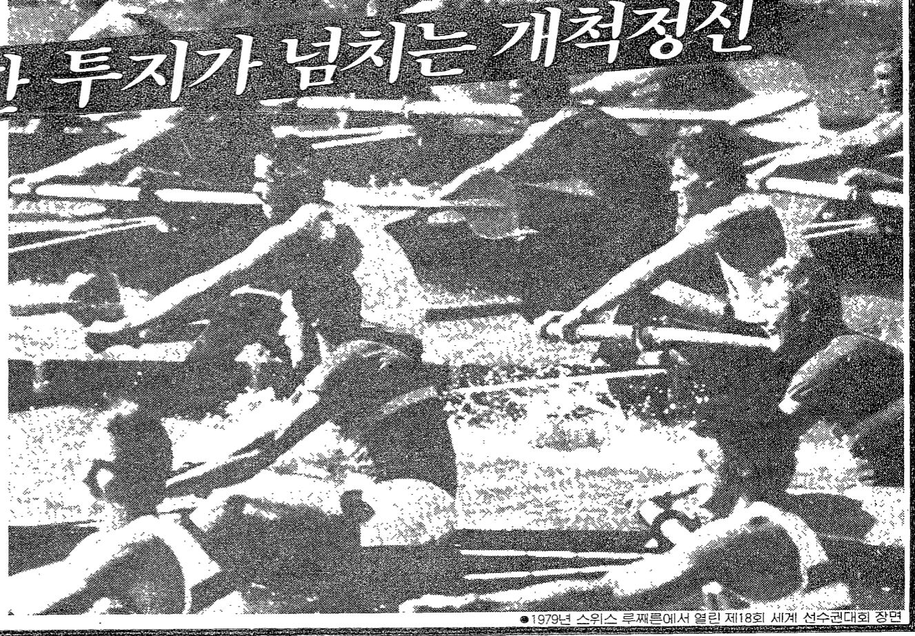
●1979년 스위스 루퍼른에서 열린 제18회 세계 선수권대회 장면

진취적인 기상과 강인한 투지가 넘치는 개척정신... 스포츠를 통해 배우는 삶의 정신. 조정 선수들의 투쟁을 통해 진정한 개척정신을 배워야 한다는 주장.