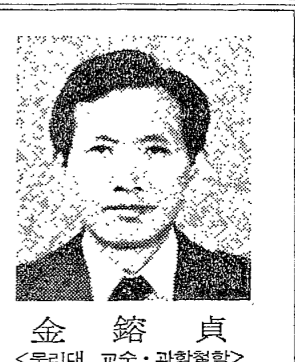
—지령 800호 발표— 金 鎬 貞

대통령령 제800호... 이명박 대통령은 15일 오전 10시 30분 서울 중구 동대문로1가 동국대학교에서 열린 '지령 800호 특권 차액' 발표 기자회견에서 이명박 대통령을 비롯한 각계 인사들이 참석했다.