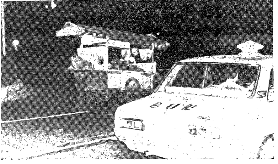
生活時間의 연장을 요구하고 있는 時節에서 通禁은 各계各層의 사람들에 따라 大 小의 差를 보이기 容易하다