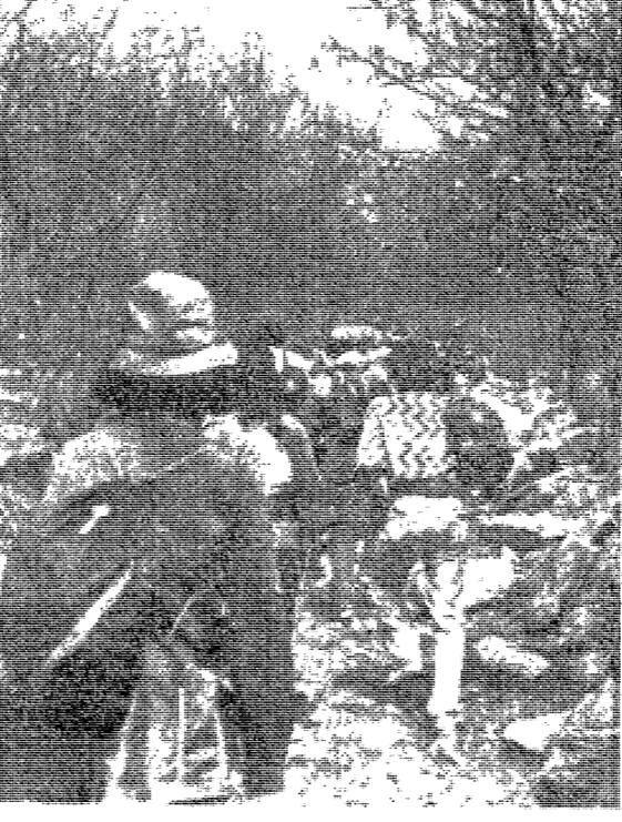
제12회 「東國人 등산대회」가 2천여명이 참가한 가운데 대산산 일원에서 있었다.

3백51팀 2천여명參加 이사장賞電氣工 3년팀 차지 道說寺서 장기자랑 순서도 가져