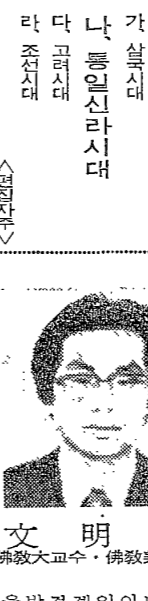
文 明 大 (Wen Ming Da) 著

한국의 불교미술사는 오랜 역사를 가진 것으로, 고대부터 근대로 이르기까지 다양한 양상을 띠고 있다. 불교의 전래 이후, 한국 고유의 불교미술이 발달하게 되었다. 이 책은 한국의 불교미술사를 체계적으로 정리하고, 그 특징과 가치를 설명하고 있다.