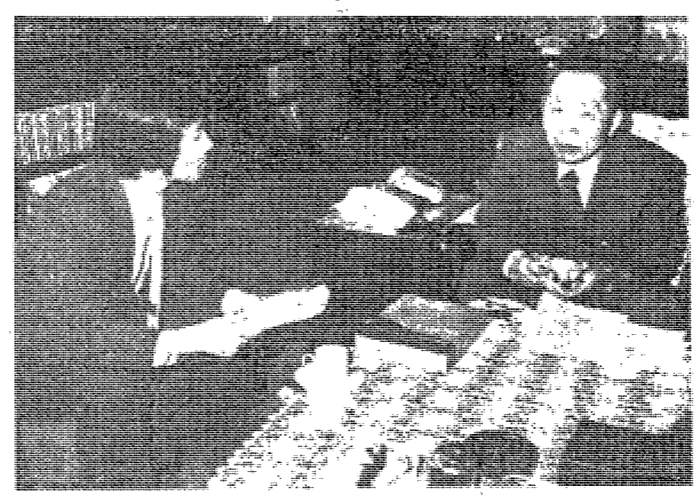
鄭총장, 本社 記者와 단독 인터뷰

【서울 31日電】 동국대학교는 「東國 發展의 청사진」을 제시했다. 이번 청사진에서는 동국대학교의 발전 방향과 목표에 대해 제시되었다. 鄭총장은 「東國 發展의 청사진」을 제시하며, 동국대학교는 「東國 發展의 청사진」을 제시했다. 이번 청사진에서는 동국대학교의 발전 방향과 목표에 대해 제시되었다.