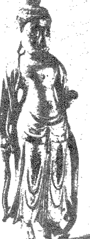
金銅菩薩立像 (Golden Copper Standing Bodhisattva Image)

문화 예술의 절정기는 언제인가? 문화 예술의 절정기는 인간의 정신적, 문화적 성취가 최고조에 달하는 때를 말한다. 문화 예술의 절정기는 인간의 창의력과 상상력을 최대한 발휘하는 때이다.