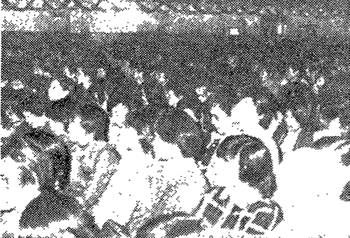
◇지난 21일, 신입생 환영회가 체육관에서 있었다.