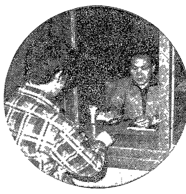
경비원 야간 순찰로 東岳을 경비

경비원 야간 순찰로 東岳을 경비 경비원 야간 순찰로 東岳을 경비 경비원 야간 순찰로 東岳을 경비