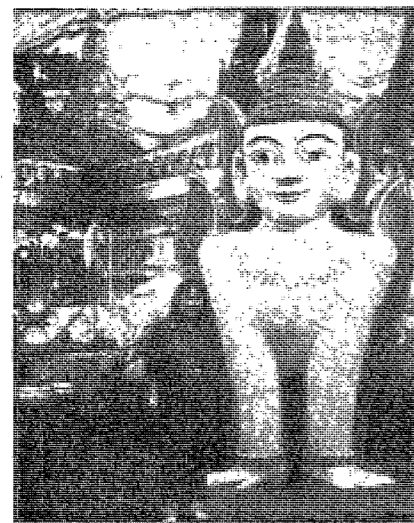
파라메시바의 불상 (Buddhist statue of Parameśvara)

佛敎國家 순례기... (Main body text of the travelogue, describing the author's journey and observations in Buddhist countries)