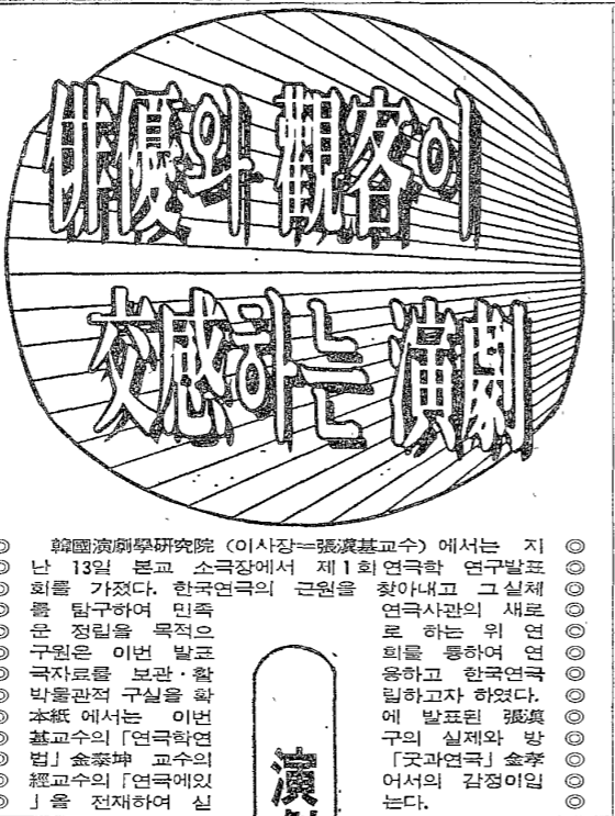
관객의 交感하는 演劇

20세기는 과학과 기술의 발달로 인류 문명에 혁명적 변화를 가져왔다. 그러나 문화적 정체성의 상실과 주체성의 위기라는 과제를 안고 있다. 이 시기에 독자적인 문화를 창달하고, 주체성을 확립하기 위해서는 문헌 정리를 통한 전통의 재발견과 기술적 접근이 필요하다. 특히, 문헌 정리를 통해 고대 문명의 지혜를 배우고, 이를 현대에 적용하여 새로운 문화를 창조해야 할 것이다. 또한, 과학적 방법론을 도입하여 문화 연구의 객관성과 정확성을 높여야 할 것이다.