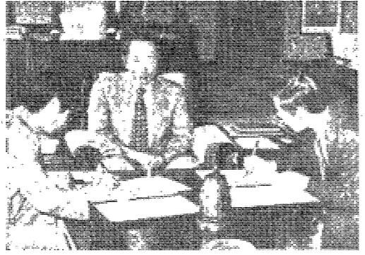
△미주 이스턴·워싱턴대학과의 인적교류... 교수·학생·도서자료등 교환...