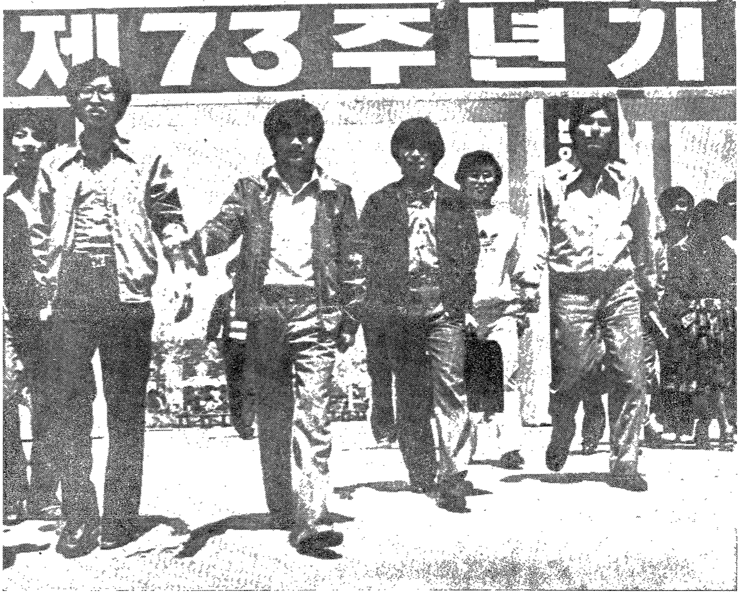
◇사진=金 載 千 記者