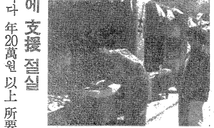
서클의 운영實能은 예산 自體 조달에 급급한 상태에 있다. 이는 서클의 운영에 있어 가장 중요한 요소인 예산을 자급자족으로 충당하지 못하고, 외부에서 자금을 조달해야 하는 상황에 처해 있다는 것을 의미한다.